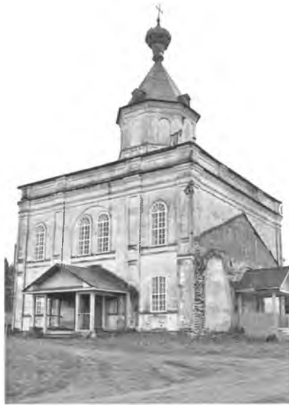
Крестовоздвиженский храм в Пермесе ждёт, когда же начнутся регулярные богослужения