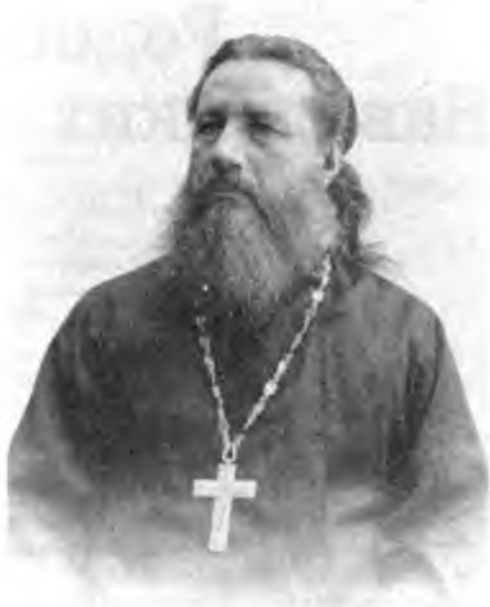
Протоиерей Иоанн Гвоздев - член Государственной Думы

В 1912 году протоиерей Гвоздев был избран членом Государственной Думы России, а затем переизбран на второй срок. На заседаниях Думы в Таврическом дворце он показал себя искусным и мудрым парламентарием, зрелым политиком, участвовал в разработке двух зако-