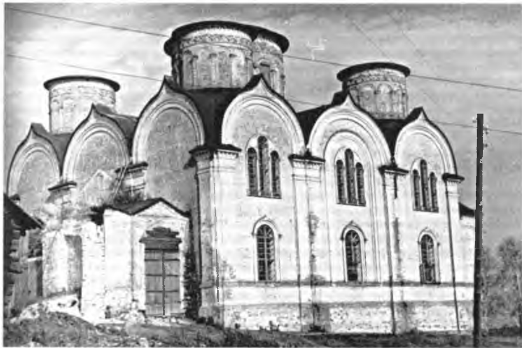
Храм в Шатеневе