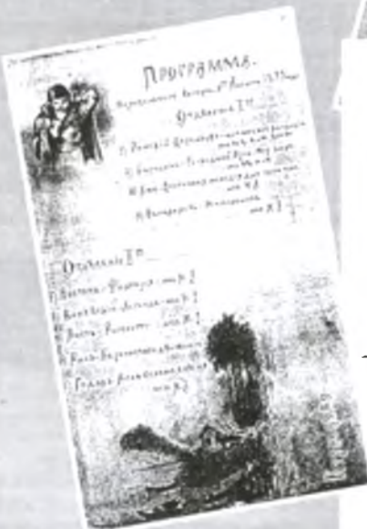
Одна из программ музыкального вечера

ГОРОДЪ НАДИВНОЕ СЪ ДОВОЛЕНІИ НАЧАЛЬСТВА Во Вторникъ 29-го Іюня 1910 года, въ НАРОДНОЙ АУДИТОРИИ Ю. М. ЗУБОВА ДАНЪ БУДЕТЬ СПЕКТАКЛЬ (въ пользу Надвиновскаго Помараго Общества) ПОСТАВЛЕНО БУДЕТЬ МАРЬЯ ИВАНОВНА