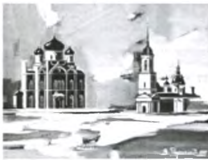
С. Кумзеро. Церковь Флора и Лавра.

Сейчас на этом месте возвышается лишь колокольня, разрушенная временем и людьми.