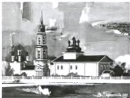
С. Шапша. Никольская церковь.