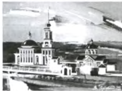
С. Лещево. Воскресенская церковь.

Лещевская Воскресенская церковь стояла на самом берегу реки Кубены. Место постройки было «указано» явлением святой иконы.