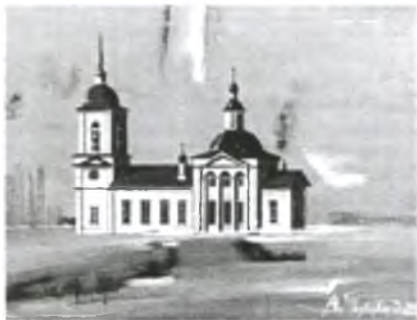
Ц. Ильинская с. Ильинское.

Точная дата постройки церкви неизвестна.