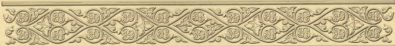
St. Paul Obnorsky Holy Trinity Monastery