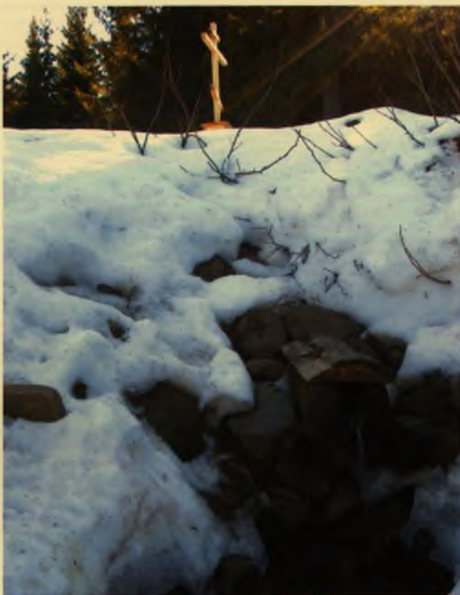
Святой источник The Holy Spring in winter

Над могилой святого Павла была поставлена надгробная рака, а на ней положен крест, которым Преподобный Сергей благословил своего ученика на пустынный подвиг в северных лесах.