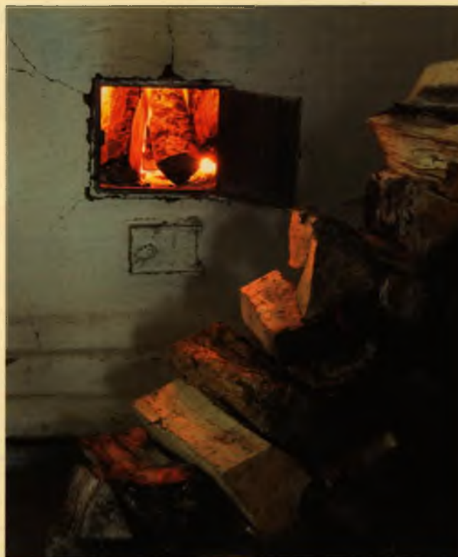
Печь в Троицком соборе Old Russian stove in the Trinity Cathedral