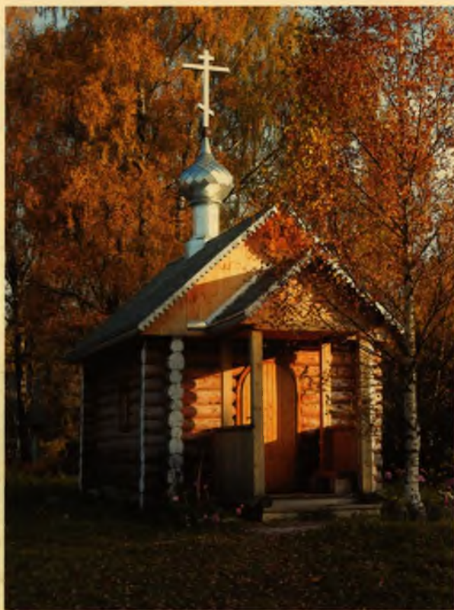
Часовня над гробом преподобного Павла The Chapel over the burial place of St. Paul

Отшельник поселился в хижине на небольшом холме, а внизу, в подгории, неспешно и мирно текла Нурма среди зеленых пологих берегов. Здесь и нашел его преподобный Сергей Нуромский среди зверей и птиц воспевающим свою песнь Богу. Смиранный Павел преклонился перед духовной мощью и авторитетом старшего своего друга и избрал его духовным отцом. Они часто навещали друг друга, причем, когда Сергей приходил в хижину Павла, тот провожал его на две трети пути. На этом месте в память о взаимной любви и дружбе двух подвижников впоследствии была поставлена часовня.