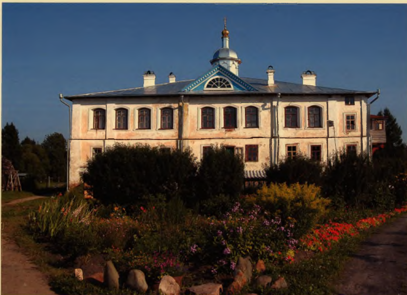
Свято-Троицкий Павло-Обнорский монастырь Front view of the St. Paul Obnorsky Holy Trinity Monastery

Сергию Радонежскому искать у него духовной мудрости и духовного руководства. Немало времени провел он «у Троицы», и сам Троицкий игумен дивился его смирению и высокой добродетели.