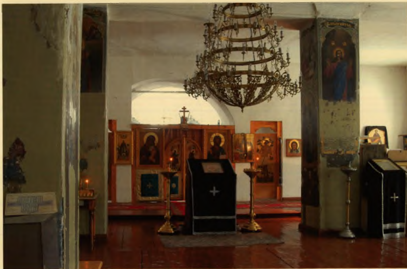
Интерьер Троицкого собора Inside the Trinity Cathedral

скоро превзошел братьев в посте, бдении и молитве и, желая обрести опытного духовного наставника, пришел к Преподобному Сергию. Преподобный провел его через все монастырские послушания, чтобы будущий устроитель обители иноческой был сведущ во всем, что касается монашеской жизни, научил его совершенному отсечению своей воли, нерассуждающему послушанию, высокому искусству «умного делания». Удостоверившись в том, что Павел стал совершенным иноком, Преподобный Сергий благословил его удалиться на безмолвие в пустынную келлию, в которой преподобный Павел провел пятнадцать лет. Отсюда подвижник ушел в Вологодские пределы, ища совершенного уединения. Преподобный