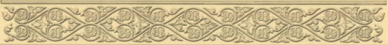
St. Paul Obnorsky Holy Trinity Monastery