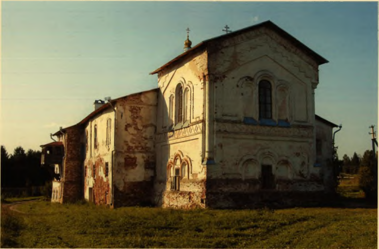
Троицкий собор Trinity Cathedral

вниз по течению Нурмы, увидел нечто такое, от чего застыл на месте в великом и радостном изумлении. На небольшой поляне рядом со своей келлией стоял пустынник и кормил из собственных рук лесных птиц. Они спокойно садились на его руки, на плечи, на голову и деловито подбирали крошки с ладони. Рядом стоял медведь, вокруг, не пугая и не пугаясь друг друга, бежали лисицы, зайцы и разные мелкие зверьки. В этом лесном Адаме преподобный Сергей узнал своего сподвижника по Троицкому монастырю Павла, которого православные христиане почитают как преподобного Павла Обнорского. Он недавно пришел сюда из Комельского леса, где подвизался довольно долго в полном одиночестве.