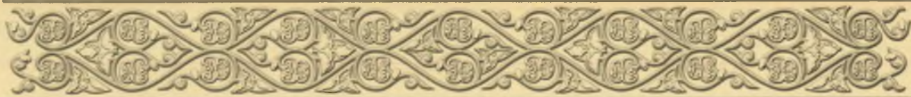
St. Paul Obnorsky Holy Trinity Monastery