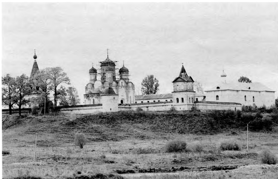
Лужецкий Можайский монастырь со стороны Москвы-реки

ным". Во главе обители был другой человек, но имя его осталось неизвестным. Сам же основатель выполнял наиболее тяжелые работы: на всю братию колол дрова и носил воду. Он начинал так, как начинал его учитель, преподобный Сергей Радонежский.