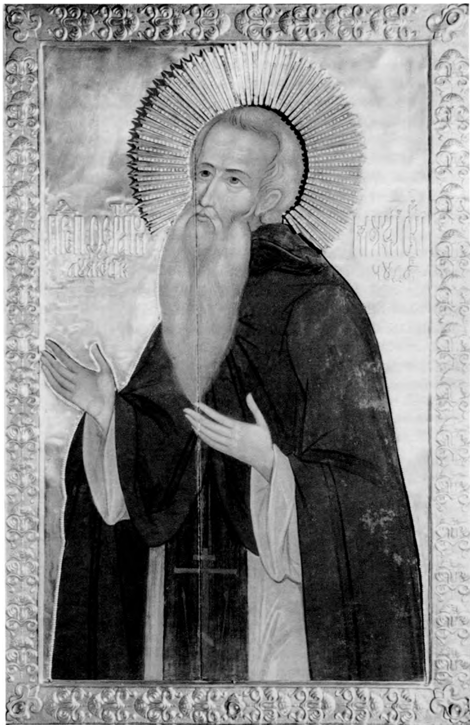
Икона преподобного Ферапонта с раки, находившейся в Лужецком Можайском монастыре