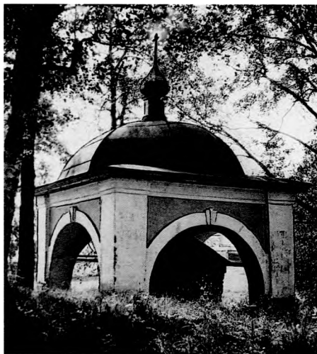
Сень над землянкой, где первоначально поселились преподобные Кирилл и Ферапонт, придя на Белоезеро. (Каменная сень XIX в. над деревянной сенью XVIII в.)

Москву. Тем временем старцу Кириллу было видение. Во время молитвы он услышал голос Богородицы: “Кирилле, изыди отсюда и иди на Белоезеро, тамо бо уготовах ти место, в нем же возможши спастися” [1, 206]. И, когда вернулся из путешествия Ферапонт, Кирилл обратился к нему с расспросами о виденном на Севере, спросил также, есть ли там места уединенные, где можно безмолвствовать иноку. “Весьма много там таких мест, отче”, — ответил Ферапонт. Вскоре оба старца отправились в “Белозерскую страну”.