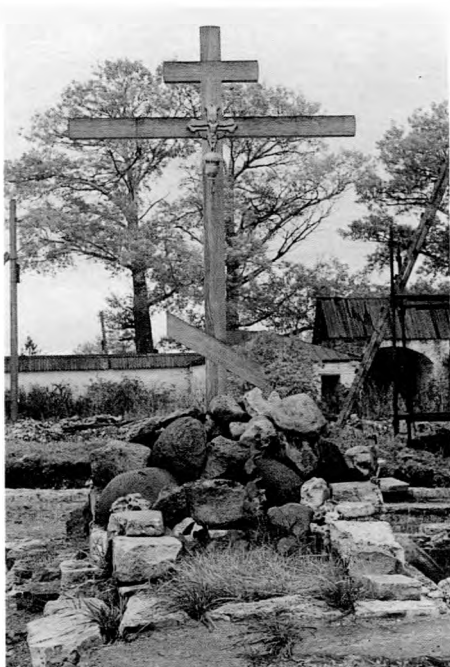
Место упокоения преподобного Ферапонта в Лужецком монастыре. Мощи святого находятся под спудом

Ферапонт не знал, зачем его вызывали в Можайск, от путешествия уклонялся, считая, что ему неуместно выходить “в мир, на смех людям”, но по настоянию князя отправился в путь. Князь встретил старца с большими почестями и обратился к нему с просьбой — основать новый монастырь. Преподобный долго отказывался, но по молитвенном размышлении смирился, глубоко тоскуя, однако, по своей белозерской обители. Семидесятилетним