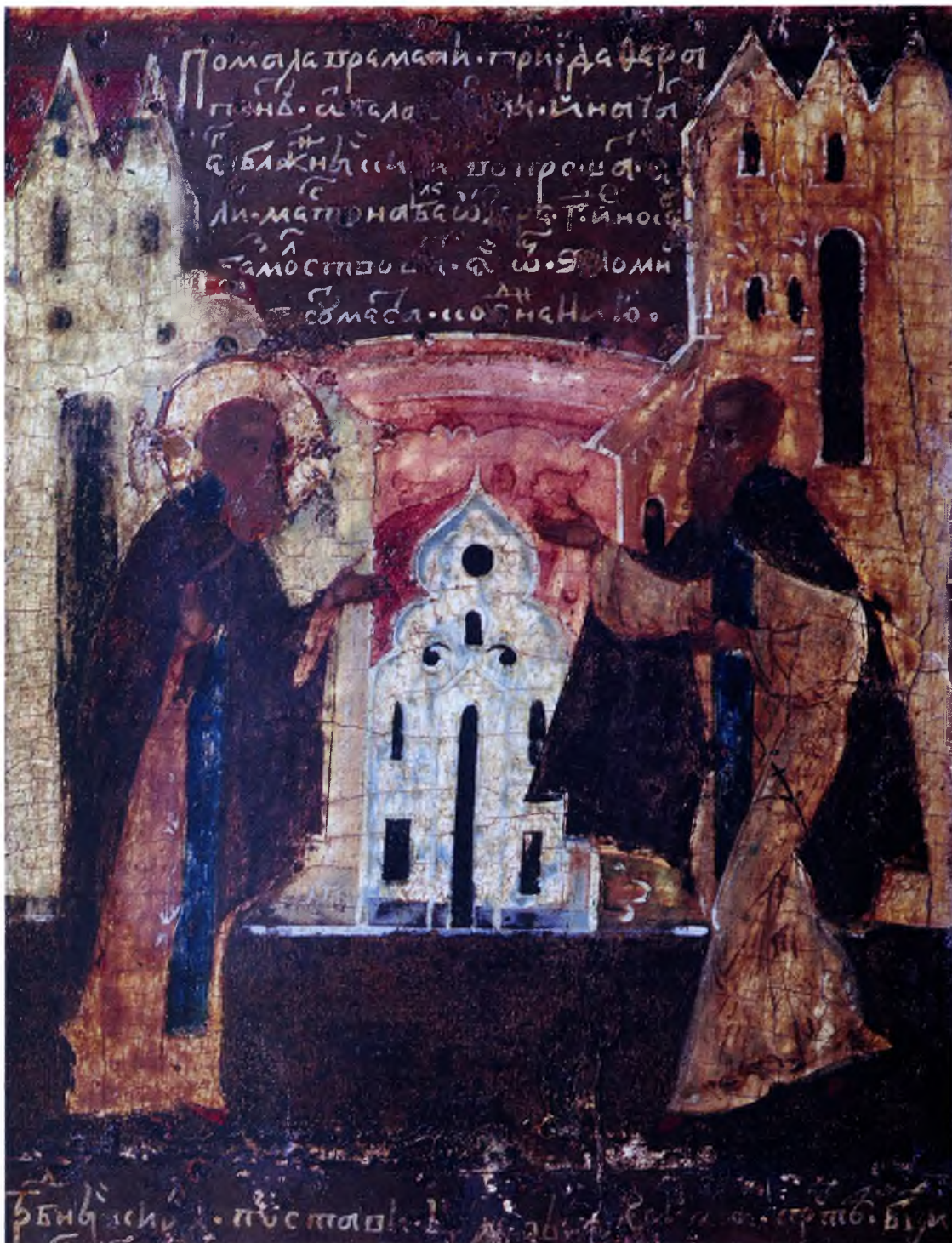
Беседа преподобных Кирилла и Ферапонта Клеймо иконы «Преподобный Кирилл Белозерский, с 16 клеймами жития». Начало XVII в. Русский Север. Государственный Эрмитаж, Санкт-Петербург

Став свидетелем чуда, старец решил посоветоваться с монахом Ферапонтом, который однажды посещал Белозерье по хозяйственным делам