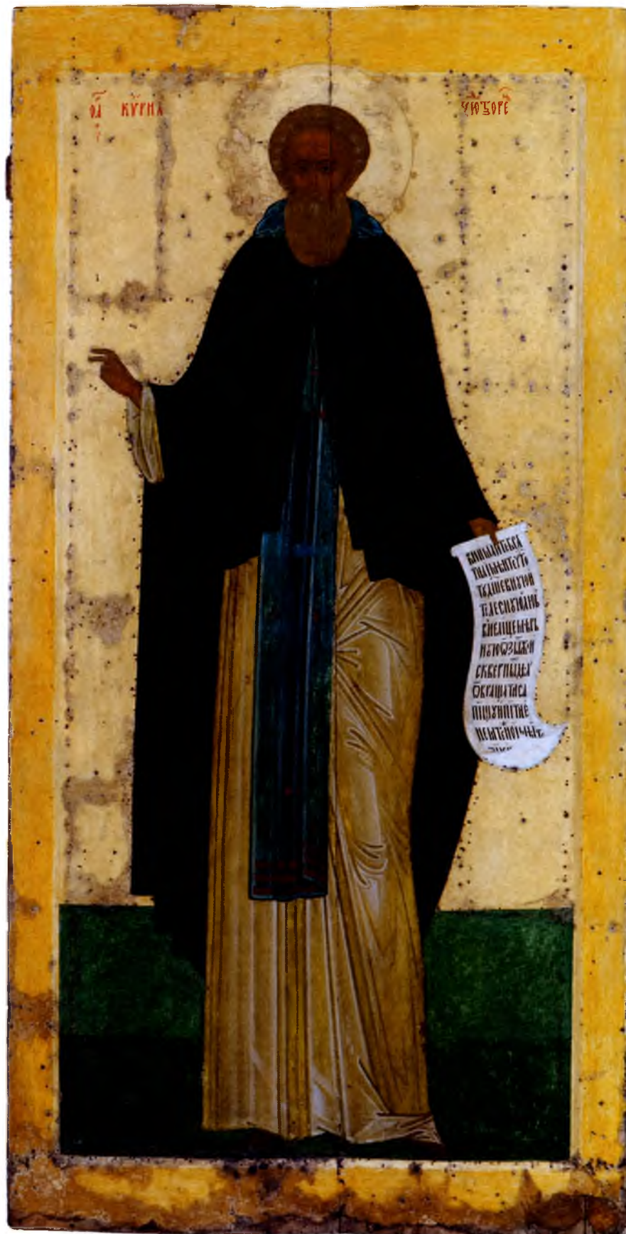
Дионисий. Преподобный Кирилл Белозерский

Согласно житию преподобного Кирилла, начало монастырю было положено около 1397 г. Через некоторое время Ферапонт покинул своего друга