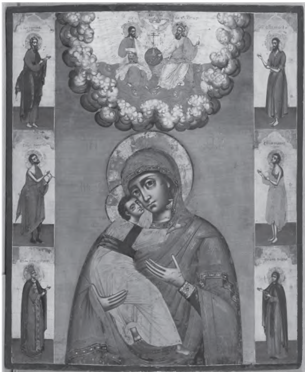
Ил. 3. Св. Иоанн Устюжский. Фрагмент иконы «Богоматерь Владимирская». Борис Деомидов, 1707 г.