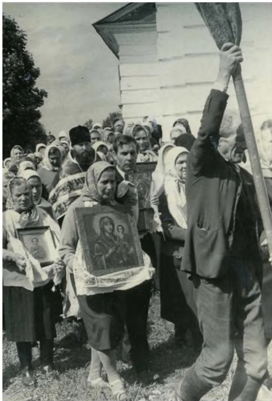
▲ Крестный ход вокруг Покровского храма близ Кириллова. 70-е годы XX века