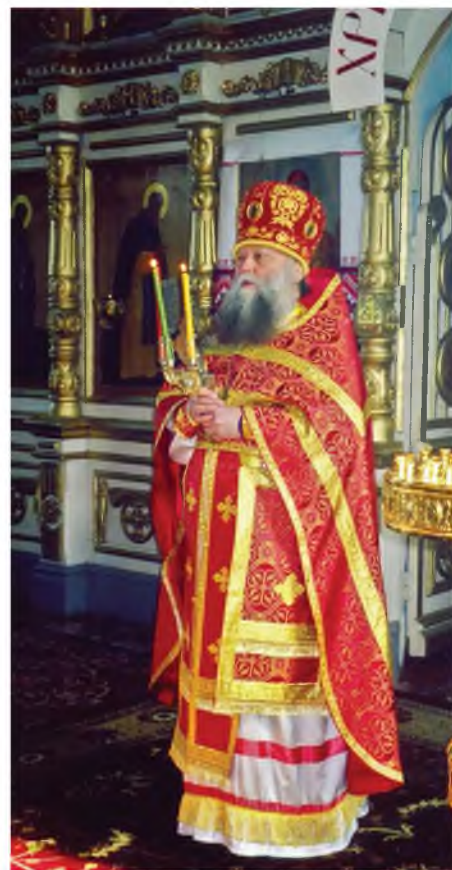
▲ В Андреевском храме