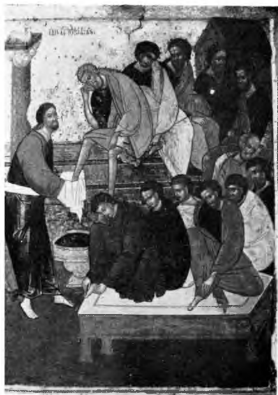
Икона «Омовение ног» работы неизвестного мастера. XVI век.