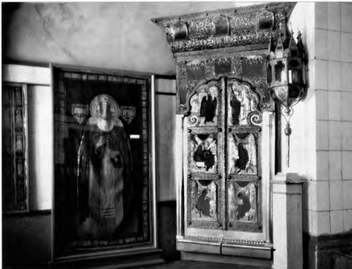
Экспозиция музея Фотография 1957 г.

стасы церкви Кирилла, Воскресенского собора Горлицкого монастыря, а также часть икон из церкви Преображения, Епифания и других храмов Кирилло-Белозерского монастыря. На следующий год в музее по указанию властей были подготовлены три списка на ликвидацию. По ним числилось 1000 произведений XVII—XX веков 33 . К счастью, многие памятники сохранились благодаря включению в антикварно-обменный фонд. Распродать или уничтожить иконы помешала начавшаяся в 1941 году война, после которой большая часть ранее списанных вещей вновь была включена в музейный фонд.