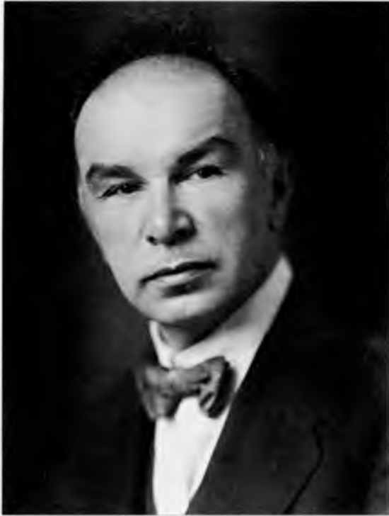
Александр Иванович Анисимов (искусствовед и реставратор)