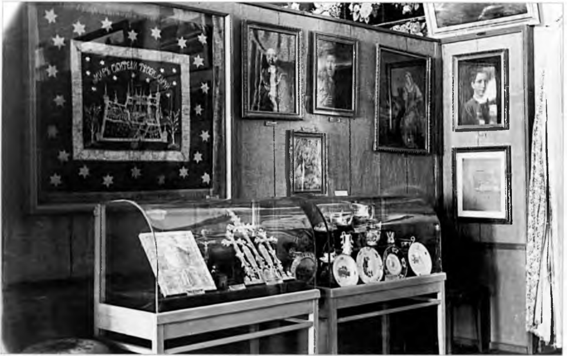
Экспозиция музея Фотография 1960 г.

одновременно с реставрацией монастырских храмов шла реставрация иконостасов. Возрождением иконописи Кирилло-Белозерского музея занимались четыре крупнейших учреждения: Всесоюзный научно-исследовательский институт реставрации (ВНИИР, до 1979 г. — ВЦНИЛКР), Всероссийский художественный научно-реставрационный центр им. академика И.Э. Грабаря (до 1973 г. — ГЦХРМ), Межобластная специальная научно-реставрационная производственная мастерская треста «Росреставрация» (МСНРПМ) и Вологодская специальная научно-реставрационная производственная мастерская (ВСНРПМ, вологодский участок МСНРПМ). Кроме того, с 1972 года в штате музея появился собственный реставратор темперной живописи.