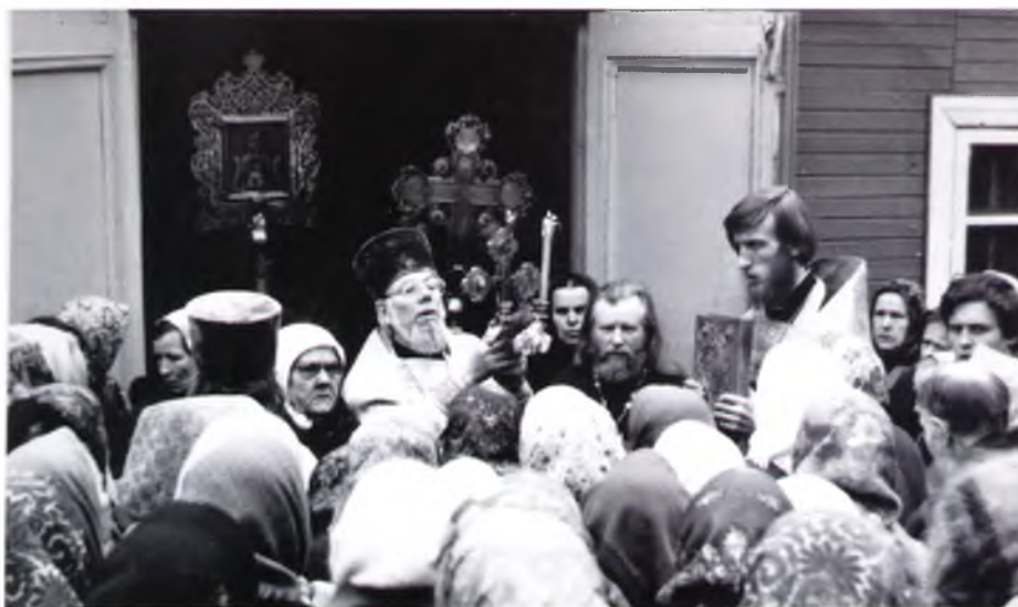
▲ У Стефановского храма