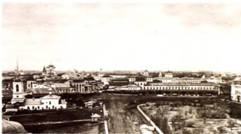
Ансамбль зданий Каменного моста замыкает перспективу Сенной площади (ныне площадь Революции). Фотография конца 1860-х годов

В последней четверти XVIII века возводятся наиболее значимые общественные здания города. В начале 1780-х годов — здание, приобретенное Дворянским собранием (ныне Лермонтова, 21), в 1780–1786 годах — дом генерал-губернатора (Зосимовская, 1), в 1786–1792 годах — дом губернатора (Ленина, 19), в 1789–1796 годах — Ярмарочный дом (Мира, 6), в 1781–1786 годах — здание для Странноприимного дома и Народного училища (Галкинская, 1).