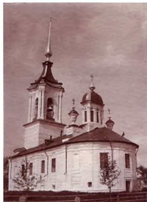
Крыльцо-полуротонда церкви Варлаама Хутынского. Фотография начала XX века. Украшенный полуротондой вход, увитые гирляндами главки-вазоны рядом с овальным куполом — все эти необычные, даже причудливые для церковной архитектуры детали, вероятно, привнесены архитектором из арсенала оформления садово-парковых ансамблей