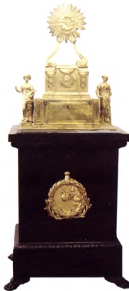
Тумба с ларцом для хранения «Уложения для управления губерниями» императрицы Екатерины II. Конец XVIII века. На передней стороне тумбы — герб Вологодской губернии