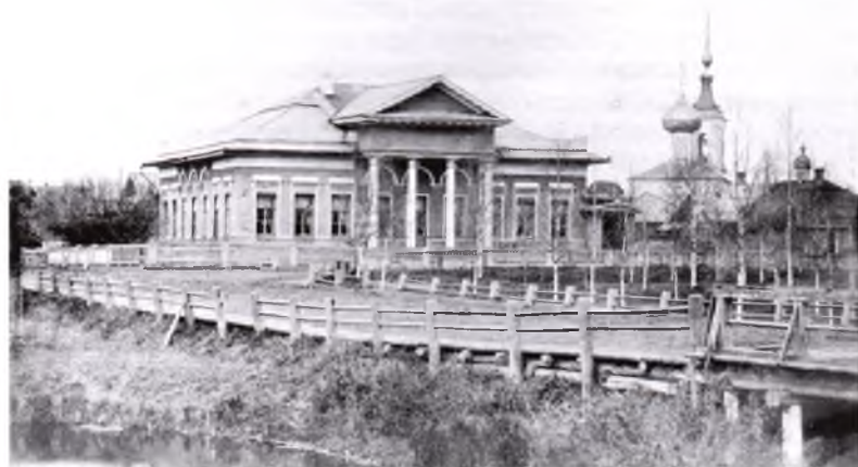
Деревянный дом Засецких на Петербургской улице — образец городской гражданской постройки в классическом стиле конца XVIII века. На переднем плане — мост через Пятницкий пруд на месте рва крепости XVI века. Фотография последней четверти XIX века

О наличии второй масонской ложи «теоретического градуса», которая существовала в Вологде в 1791–1792 годах от «московского розенкрейцера», говорят протоколы заседаний этого тайного общества. Подтверждение вологодской «прописки» ложи есть в материалах следствия и показаниях некоторых известных русских масонов. Надзирателем ложи Н. И. Новиков называл Ф. И. Остолопова.