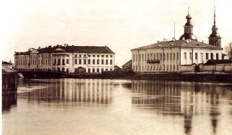
Участок набережной на Нижнем посаде Вологды с постройками конца XVIII века: дом губернатора, церковь Зосимы и Савватия, реальное училище (бывший дом генерал-губернатора). Фото последней четверти XIX века