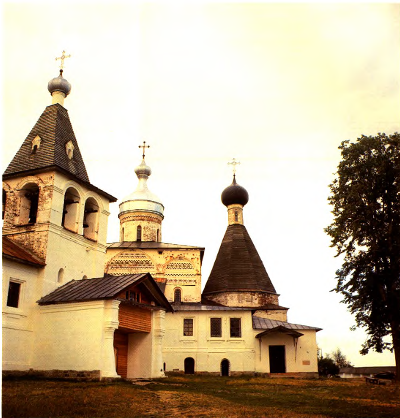
Колокольня, храм Рождества Пресвятой Богородицы, церковь прп. Мартиниана

вил в «Книге для записи лиц, посещающих Ферапонтов монастырь» следующую запись: «22-го опять посетил эту знаменитую обитель, молился, удивлялся, восхищался, радовался начавшемуся внешнему возрождению ее соответственно внутреннему благо-