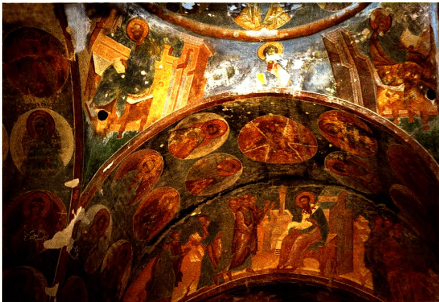
Роспись храма предположительно была вкладом Дионисия и трех его сыновей — Феодосия, Владимира, Андрея — на поминание их, «доколе монастырь стоит»

В 1989 году был зарегистрирован Ферапонтовский приход. Первое богослужение состоялось в январе 1990 года в церкви преподобного Мартиниана, отобранной у верующих в 1936 году. А летом приход получил в аренду храм Богоявления с приделом преподобного Ферапонта на Святых вратах. В 1993 году Ферапонтов монастырь посетил Святейший Патриарх всея Руси Алексий II. В 1998 году в монастыре торжественно отмечалось 600-летие обители, воздвигнут Поклонный Крест на острове, устроенном Святейшим Патриархом Никоном среди вод Бородавского озера неподалеку от монастыря.