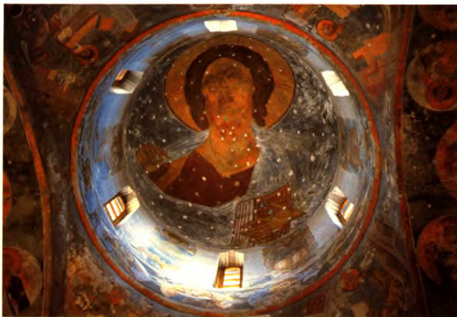
Роспись купола храма

горе Золотухе. Осенью 1998 года на этом месте был установлен Поклонный Крест. Архиерейским собором Русской Православной Церкви в августе 2000 года были причислены к лику святых для общецерковного почитания священномученик Варсонофий, преподобномученица Серафима и иже с ними пострадавшие.