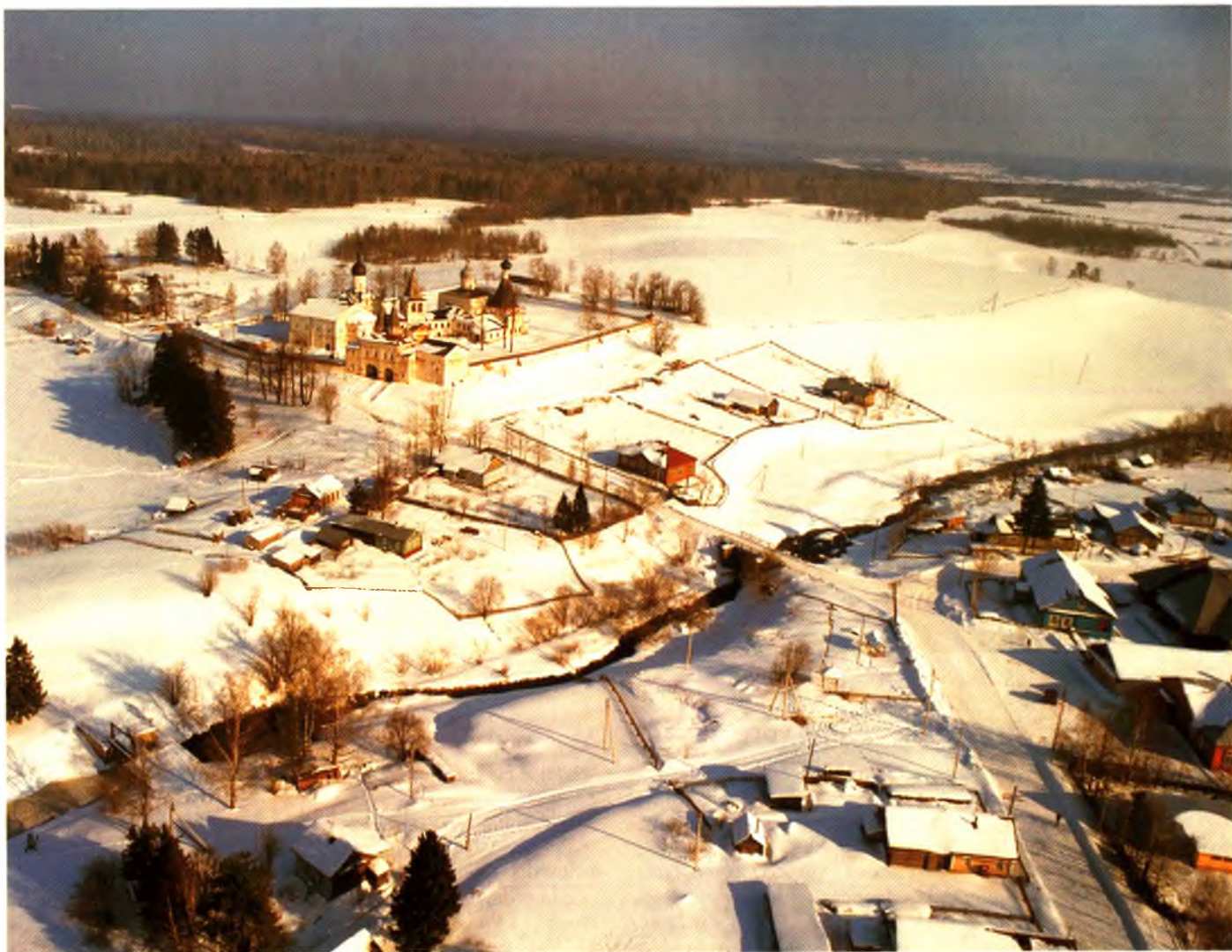
Вид на монастырь и село Ферапонтово с высоты птичьего полета

На Кресте надписи по-славянски. На поперечных перекладинах вырезаны тропарь и стихира — тексты, используемые в богослужениях. На косях перекладины вырезано: «Блаженной памяти Святейшего Патриарха всея Руси Никона», в нижней части дерева: «Поставлен первоначально Святейшим Патриархом Никоном в лето от Рождества Христова 1676, возобновлен в лето 1998 по Благословению Преосвященного Максимилиана, епископа Вологодского и Великоустюжского».