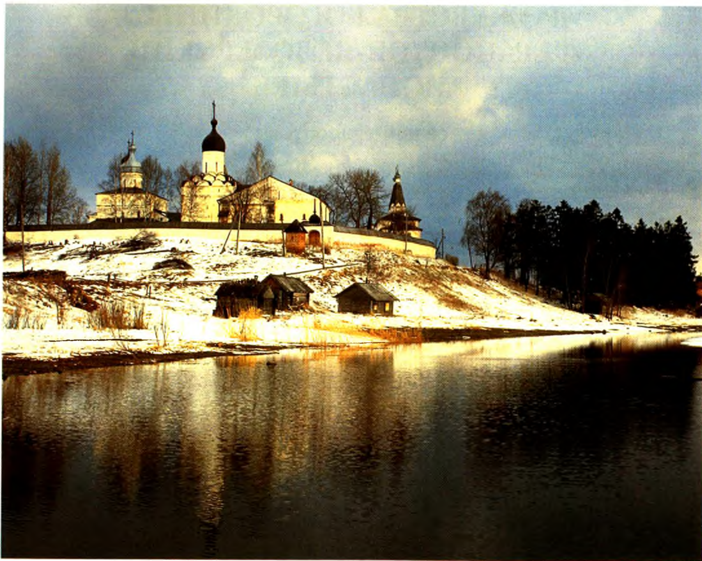
Зимний вид на монастырь с Паского озера

Другим прославленным строителем Ферапонтова монастыря был преподобный Мартиниан (около 1400-1483). Известно, что он поддерживал великого князя Василия II в период изгнания, за что последний, придя к власти, пригласил Мартиниана управлять Троице-Сергиевой лаврой. Однако в 1455 году он вернулся в Ферапонтов монастырь, коим управлял до конца дней. Мартиниан был канонизирован Московским собором 1549 года (память 12/25 января).