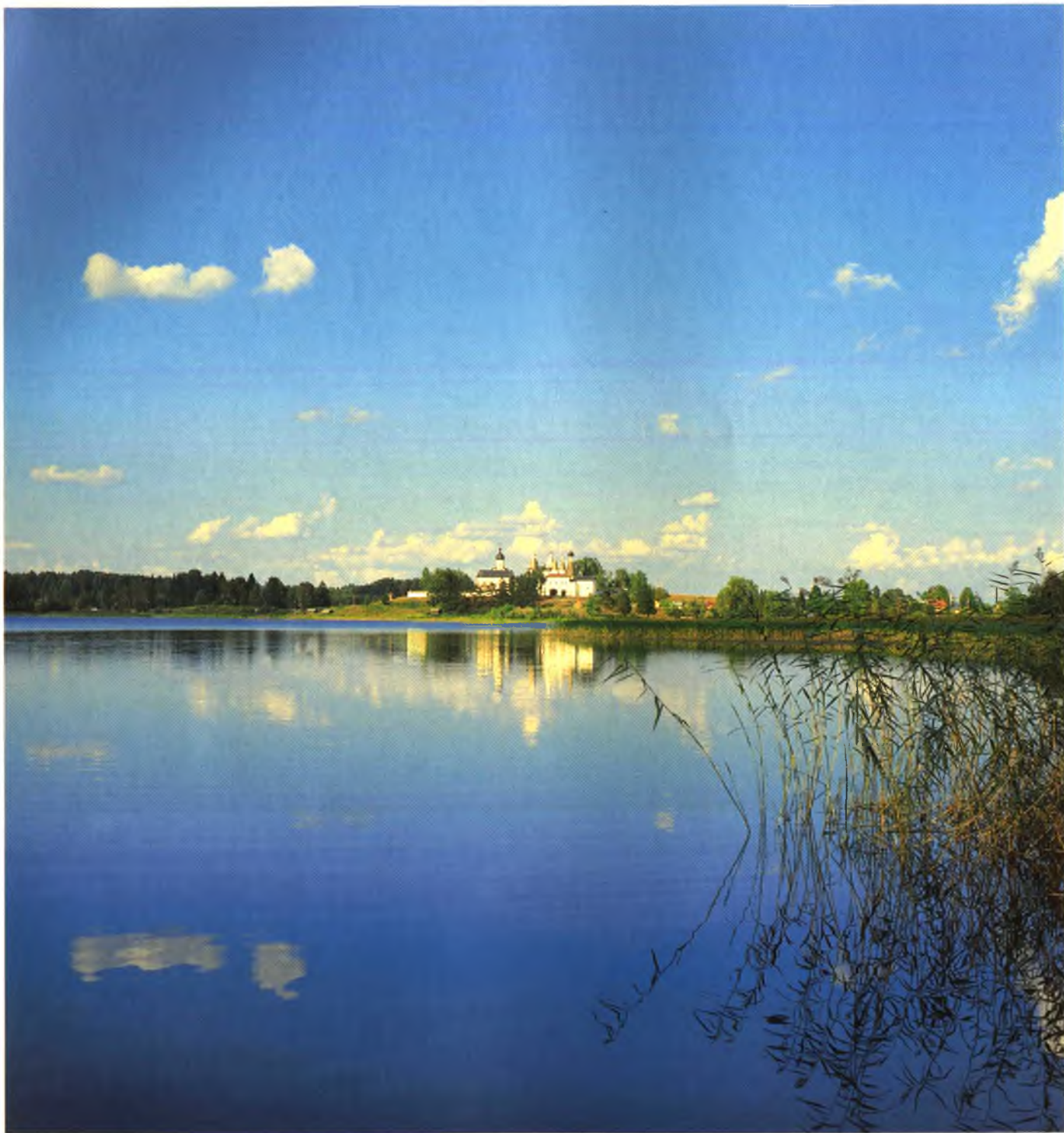
Вид на Феропонтов монастырь с Бородавского озера