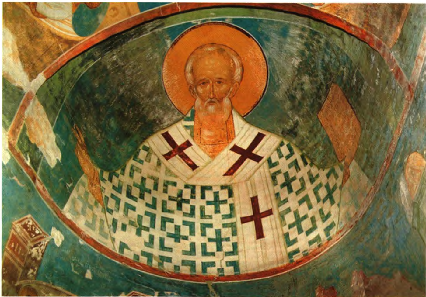
Фреска храма Рождества Пресвятой Богородицы— святой Николай Чудотворец

лет управления своим монастырем, в 1408 году, по просьбе князя Можайского Андрея Дмитриевича (сына Донского), Ферапонт оставил монастырь заботам своих учеников и отбыл в Можайск, где основал обитель также во имя Рождества Богородицы на берегу Москвы-реки, ставшую известной впоследствии как Лужецкий монастырь, где преподобный и представлялся девяностолетним старцем. Память св. Ферапонта — 27 мая (9 июня).