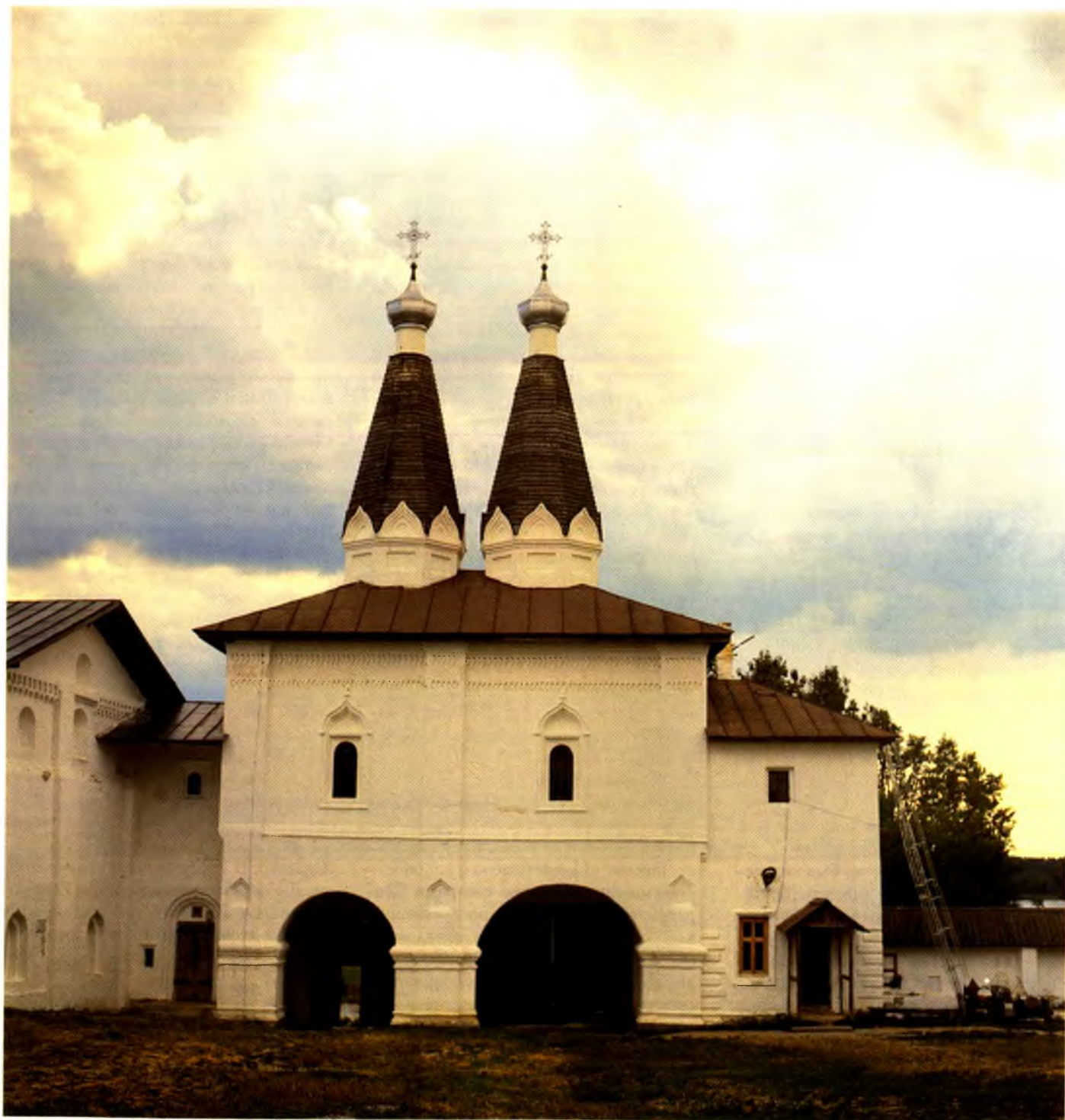
Святые ворота с церквями Богоявления и прп. Ферапонта