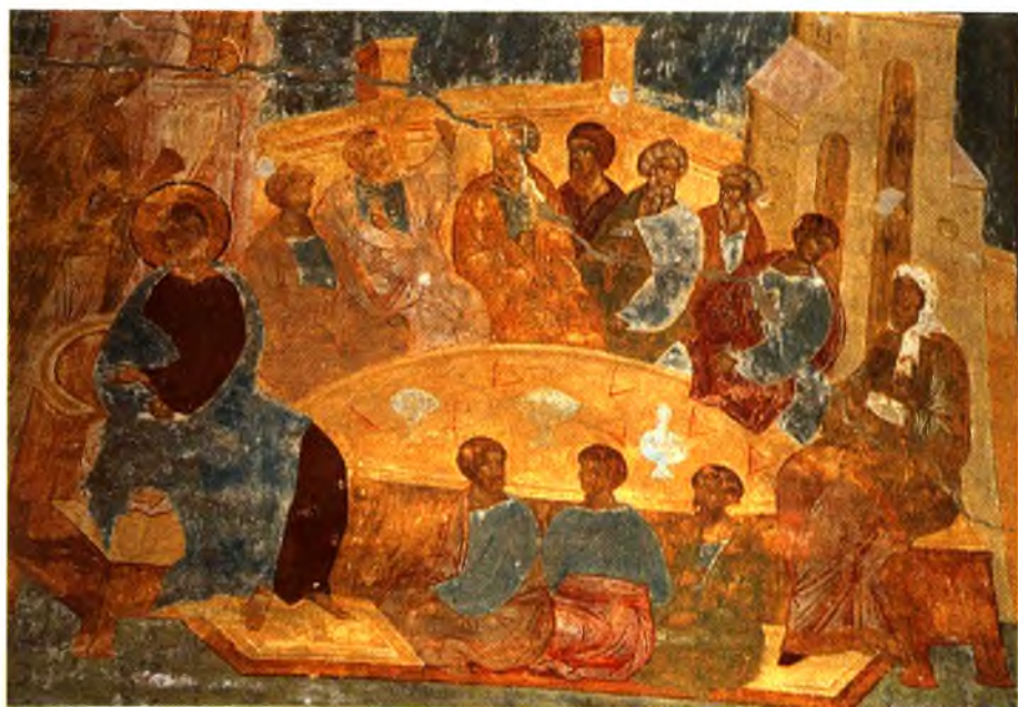
Фрагмент росписи «Тайная вечеря»