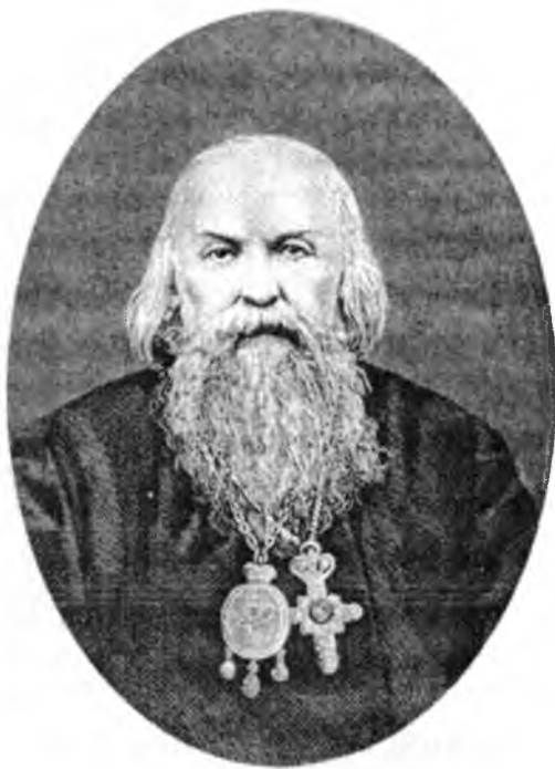
ЕПИСКОП ИГНАТИЙ (БРЯНЧАНИНОВ), епископ Кавказский и Черноморский Прижизненный портрет

- Вы знаете, в начале XIX века монашество находилось в очень печальном состоянии. И именно святитель Игнатий сумел восстановить правильный взгляд на монашескую жизнь, возвращаясь через своего духовника старца Льва к творениям и монашескому опыту преподобного Паисия (Величковского), а через него и к святоотеческому учению. Архимандрит Матфей из Троице-Сергиевой лавры, профессор Московской духовной академии, сказал кратко, но очень емко: «Благодаря творениям святителя Игнатия у нас на Руси сохранилось монашество». И грядущий юбилей святителя Игнатия - это важное событие для всех монашествующих. А поскольку и монахи, миряне имеют перед собой одну цель - подражание Христу - то и для каждого мирянина эта дата не должна остаться незамеченной.