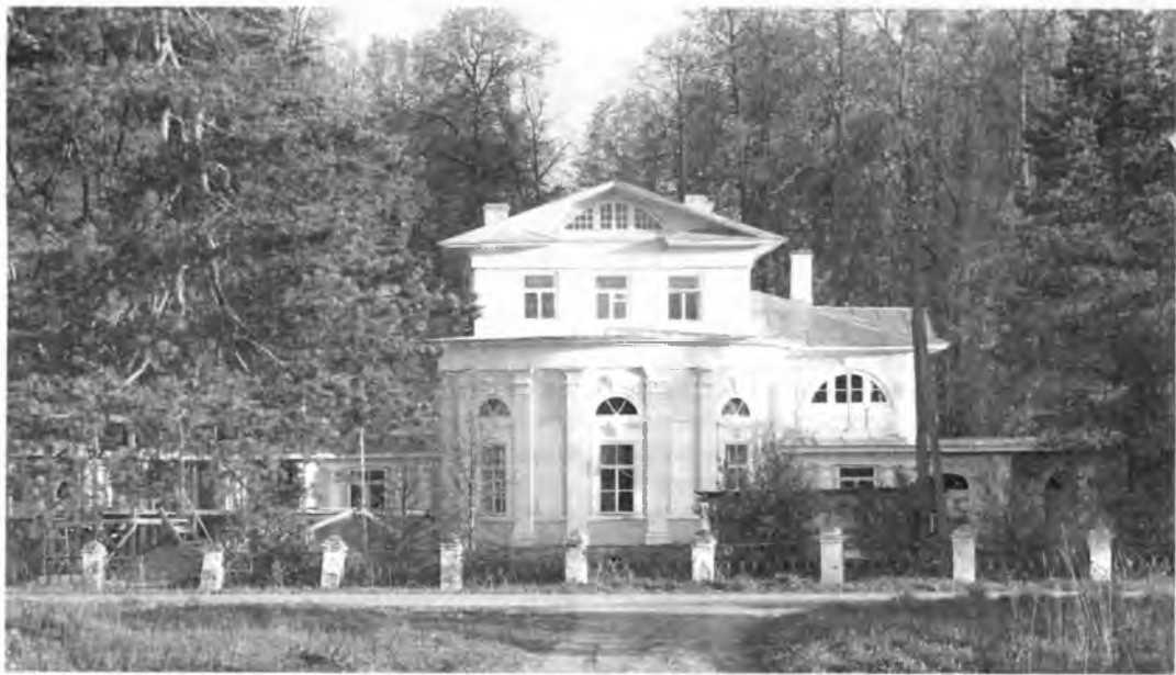
В УСАДЬБЕ БРЯНЧАНИНОВЫХ ИДУТ РЕСТАВРАЦИОННЫЕ РАБОТЫ.

Человеку даны большие возможности для достижения внешнего благополучия, но он должен довольствоваться самым необходимым в этой жизни, чтобы основные усилия направить на духовное воз-