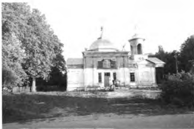
ВОССТАНАВЛИВАЕМЫЙ ХРАМ В ПОКРОВСКОМ.

Святитель Игнатий сам объясняет такое соединение, казалось бы, несоединимого - молитвы и многопопечитель-