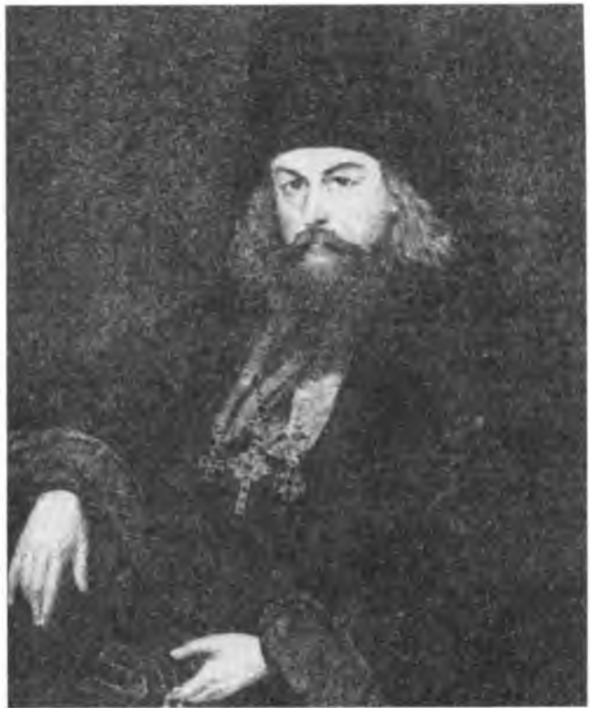
АРХИМАНДРИТ ИГНАТИЙ (БРЯНЧАНИНОВ), НАМЕСТИК СВЯТО-ТРОИЦКОЙ ПУСТЫНИ В САНКТ-ПЕТЕРБУРГЕ.

- К нему тоже отношение неоднозначное. Он делает подчас такие заявления, которые вызывают вопросы и даже критику со стороны довольно серьезных людей. Возьмем, например, его отношение к рок-музыке. В «Троицком благовестнике» - это небольшие брошюры, выпускаемые время от времени Троице-Сергиевой лаврой - несколько лет назад была напечатана статья «Рок-музыка и сатана», там приводятся данные исследования воздействия рок-музыки на людей. Однозначно показывается, что воздействия - крайне негативные, причем они касаются не только духовного, но и физического состояния человека. Что происходит после рок-концертов, мы знаем: люди крушат все, что попадает на пути, дерутся, калечат друг друга, даже убивают подчас.