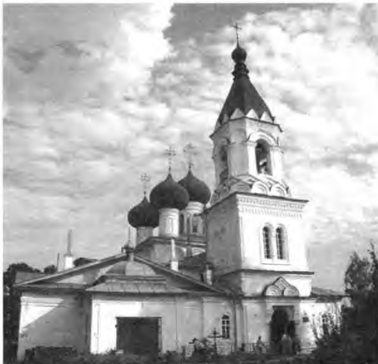
Храм Успения Пресвятой Богородицы в Вологде