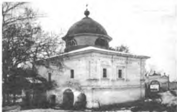
А вот так Алексеевский храм Горне-Успенской обители выглядел в начале XX века.