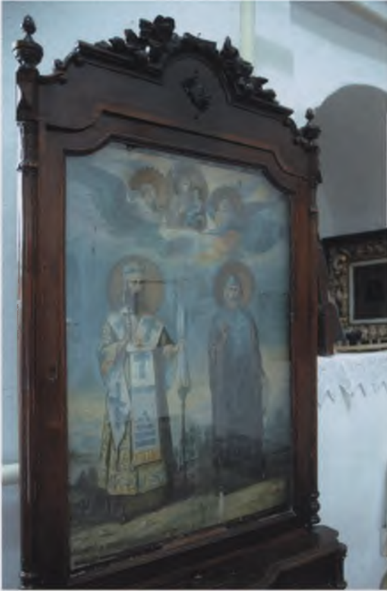
Обновившаяся икона свт. Феодосия Черниговского и преподобного Иосифа

ВСПОМИНАЕТСЯ ИКОНА, ОБНОВИВШАЯСЯ ПО ВОЛЕ БОЖИЕЙ БЕЗО ВСЯКОЙ РЕСТАВРАЦИИ, ПРЕВРАТИВШАЯСЯ ИЗ ЧЕРНОЙ ДОСКИ В КРАСИВЫЙ ОБРАЗ. И ТЕПЕРЬ СВЯТЫЕ ВЗИРАЮТ НА НАС, КАК МЫ ИЗ ТЬМЫ НЕВЕРИЯ ВОЗВРАЩАЕМСЯ НА СВЕТ БОЖИЙ, СЛОВНО ПРИМЕР ПОКАЗЫВАЮТ - СМОТРИТЕ, БОГУ ВСЁ ВОЗМОЖНО..