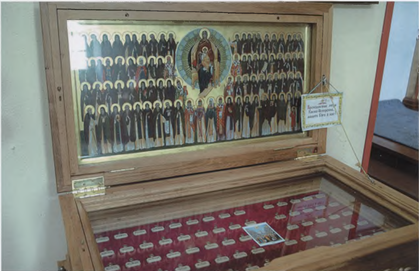
Здесь находятся частицы мощей 80 Киево-Печерских святых