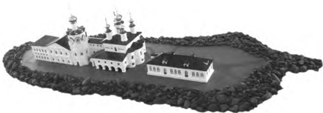
Макет монастыря, отображающий все его постройки от начала строительства и до конечной даты существования