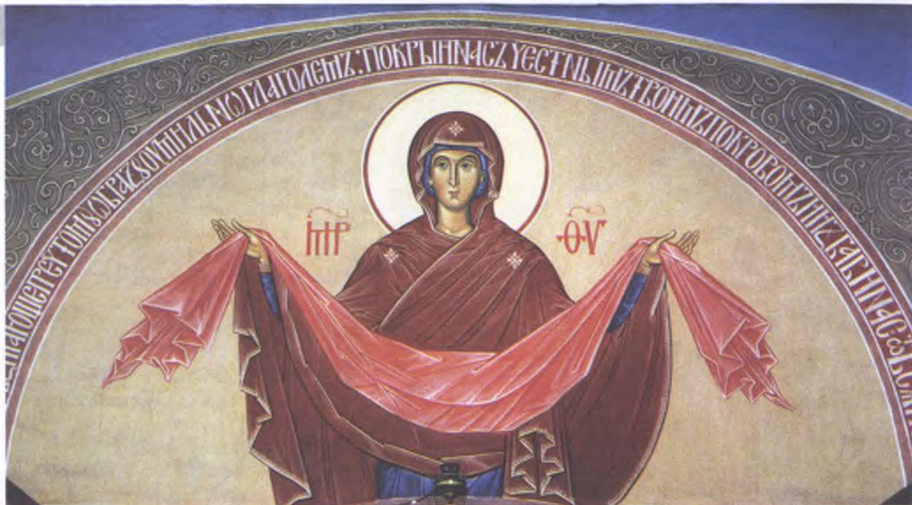
Покров Божией Матери. Центральная фреска храма Покрова-на-Козлёне. Вологда

Живопись (вверху) и роспись на камне (внизу) — работы последних лет жизни художника