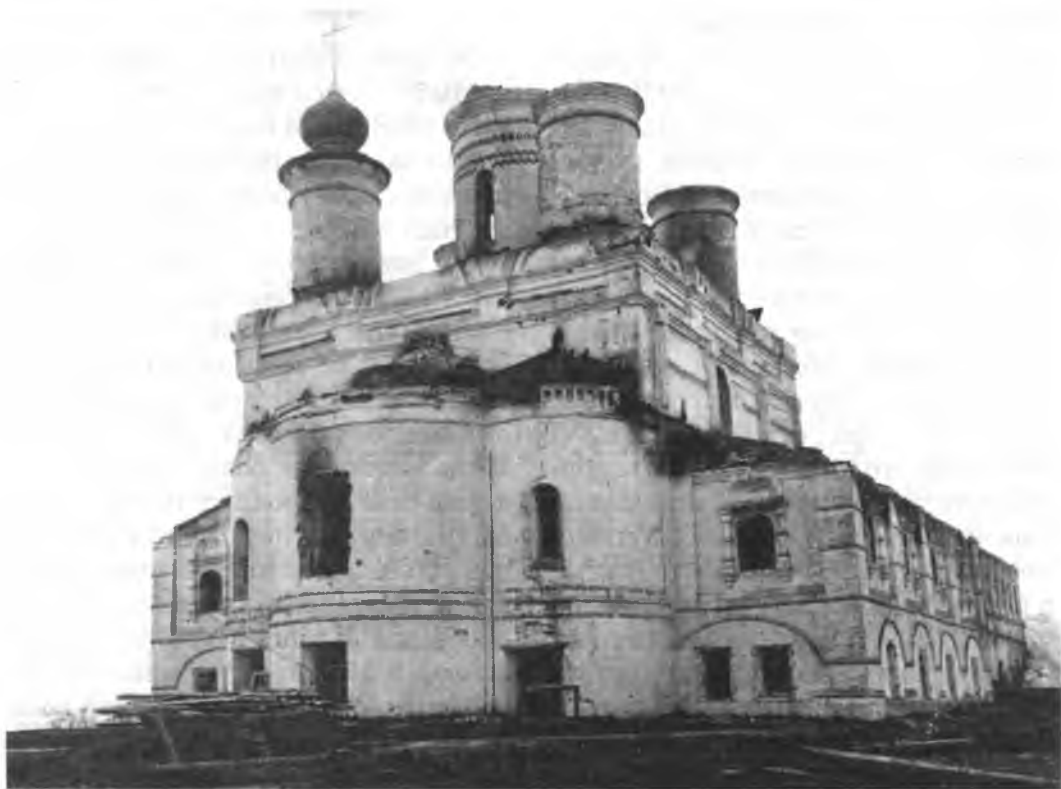
Спасо-Каменный монастырь. Вид с северо-востока. Фото начала XX века

венции (а зачастую и позже) большинство северных монастырей не имело сколько-нибудь серьезного военного значения. Так, например, известно, что даже у такого крупного монастыря, как Антониев-Сийский, в 1604 году не было никакой ограды 36 .