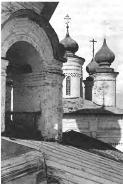
Спасо-Каменный монастырь. Главы собора и часть колокольни. Фото начала XX века

Для среднерусского (в особенности московского) зодчества, вопреки взглядам, господствовавшим в начале текущего столетия и разделявшимися К.К. Романовым, XIV и XV века были периодом бесспорного подъема. По сложности построения формы, тщательности прорисовки деталей такие памятники, как Успенский собор в Звенигороде или собор Андроникова монастыря, не имеют равнозначных решений в современной им архитектуре Пскова. Поэтому приглашение псковских мастеров в Москву Иваном III не могло наложить заметного отпечатка на развитие московского зод-