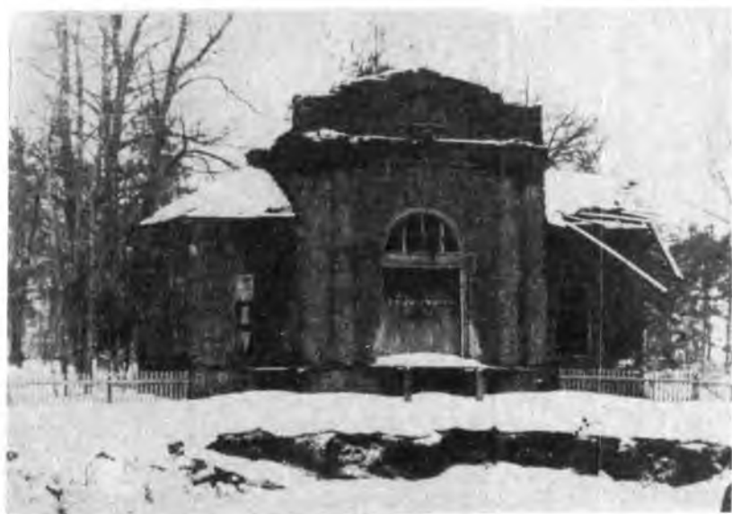
Церковь во имя Святителя Василия Великого. Современный вид.