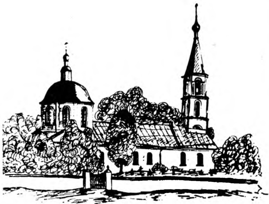
Преполовенская церковь на Васильевском кладбище. Рис. М. Ю. Хрусталева по фотографии начала XX века

Храм располагался на новоотведенном в начале XIX века Преполовенском городском кладбище (иначе Васильевском). В древности это была территория Троицкого и Васильевского приходов, что в «Троицком конце». Там же, на старом тракте, на выходе к нему стояли два деревянных храма: во имя Святителя Василия Кесарийского и Мученика Мины, оба построены «клетцки» с папертями. К началу XVII века место было уже пустым, и о храмах не упоминалось. По всей видимости, они были сожжены в 1609 году во время польской интервенции.