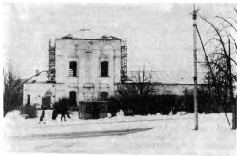
Воскресенская церковь. Современный вид. Фото 1991 г.