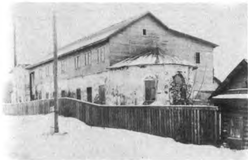
Троицкая церковь. Современный вид