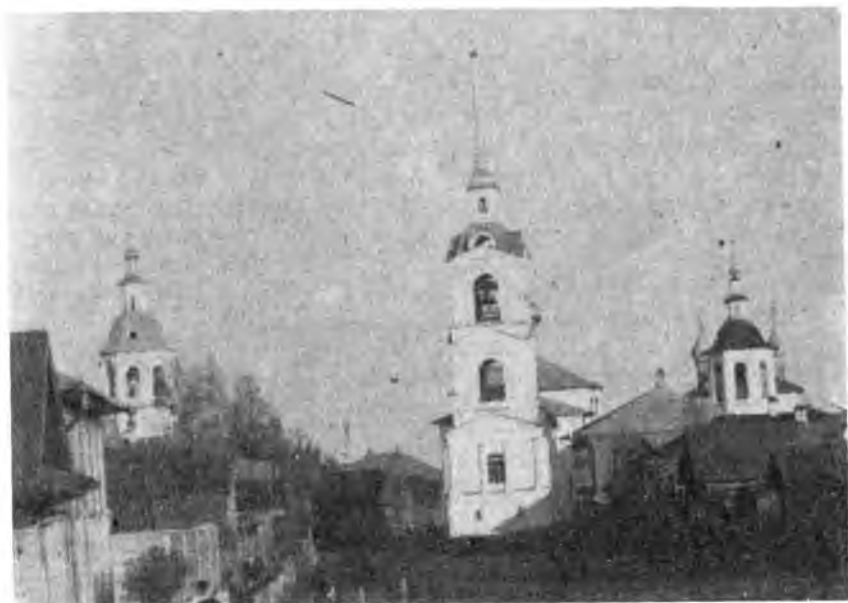
Сретенская церковь (в центре снимка), слева — колокольня Никольской церкви, справа — фрагмент (со стороны колокольни) Крестовоздвиженской церкви

На рубеже веков в Устюжне было заложено еще несколько храмов, строительство которых растянулось до XVIII века в силу различных обстоятельств. Многие из этих церквей позже неоднократно перестраивались, меняли внутреннее убранство и внешний облик. Среди них выделялась группа храмов, построенных близ вала, окружавшего посад. Ныне на их месте расположены: городской рынок, дом быта, магазины «Спорттовары» и «Книги», бывшая автостанция и подъезды к мосту через реку Мологу.