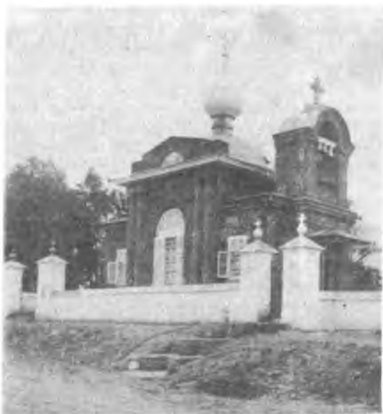
Церковь Святителя Василия Кесарийского на Преполовеном (Васильевском) кладбище