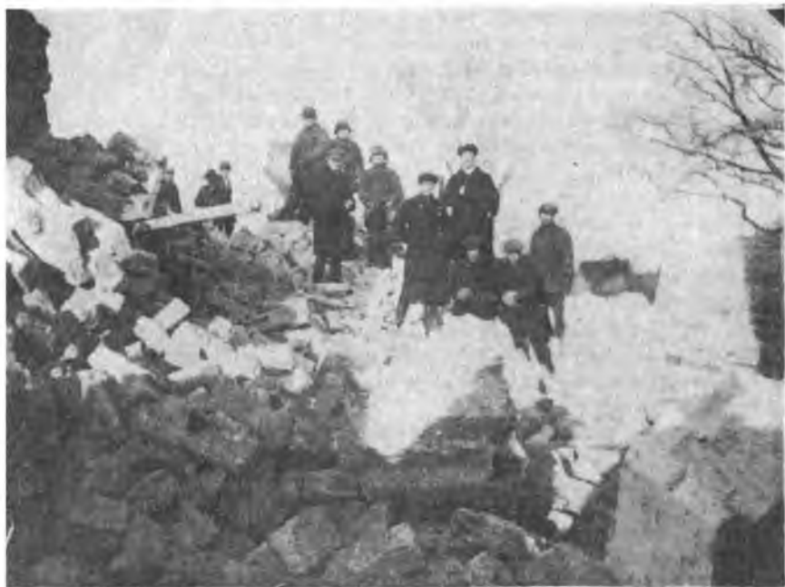
Разрушители колокольни собора Рождества Пресвятой Богородицы на ее останках