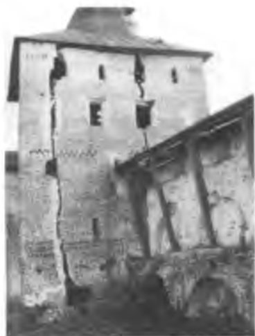
Свиточная башня до реставрации