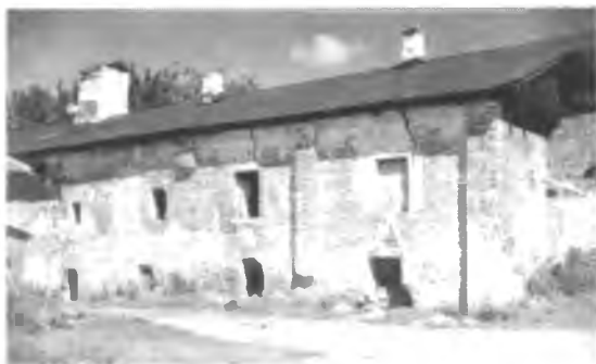
Поварня до реставрации