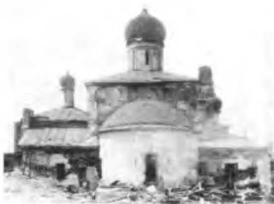
Церковь Зачатия Анны до реставрации