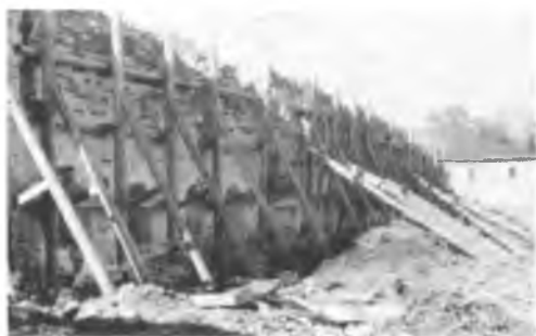
Большие больничные палаты к началу восстановительных работ