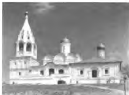
Церковь Никиты за Яузой после реставрации