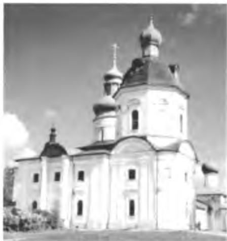
Церковь Кирилла после фрагментарной реставрации фасадов