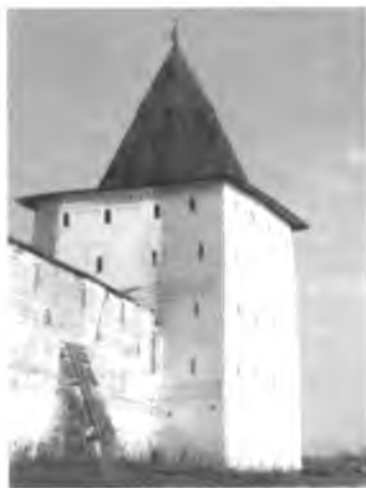
Свиточная башня после реставрации