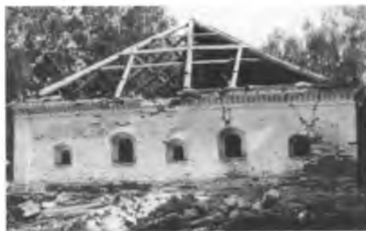
Малая больничная палата в начале восстановительных работ