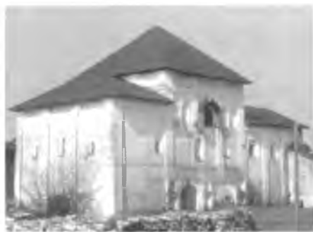
Церковь Преображения до реставрации