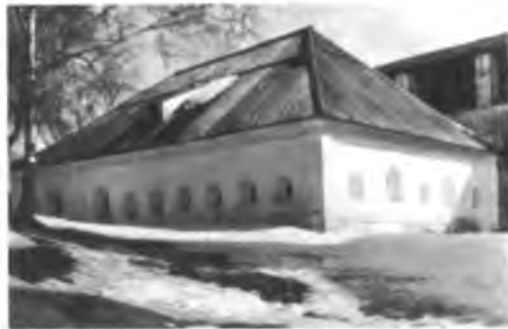
Малая больничная палата после реставрации