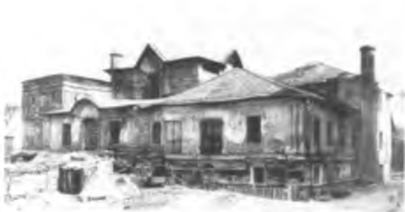
Церковь Никиты за Яузой до реставрации