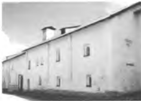
Поварня после реставрации