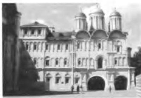
Комплекс Патриарших палат. Южный фасад после реставрации