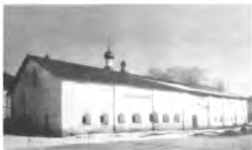
Большие больничные палаты после реставрации