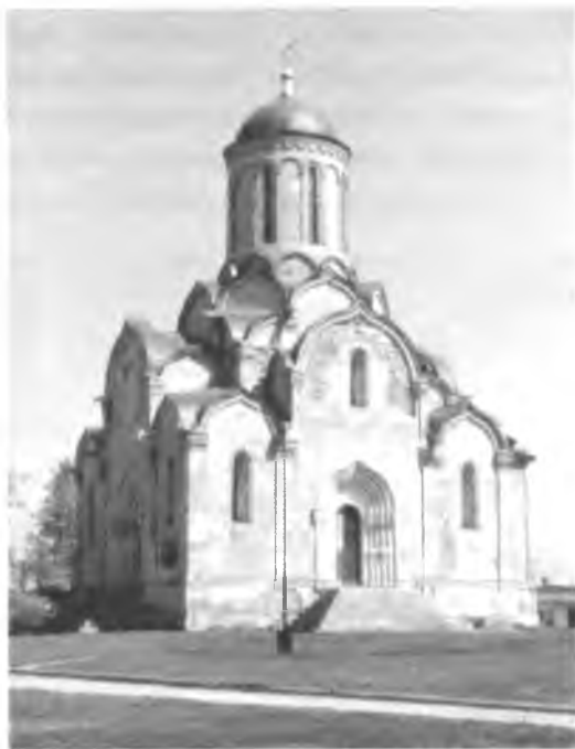
Спасский собор после реставрации