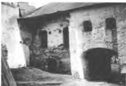
Келарский корпус. Фрагмент тыльного фасада до реставрации (утрачен северо-западный угол здания)