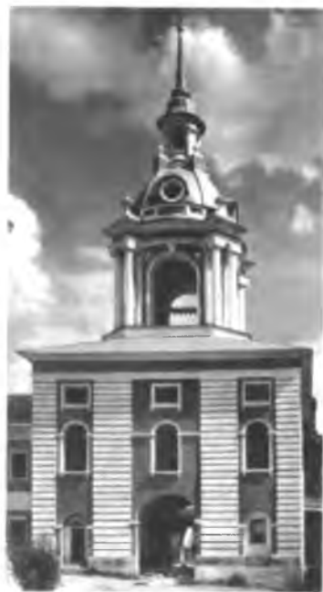
Колокольня Знаменского монастыря после реставрации