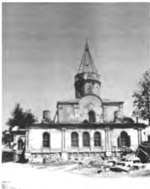
Спасский собор до реставрации