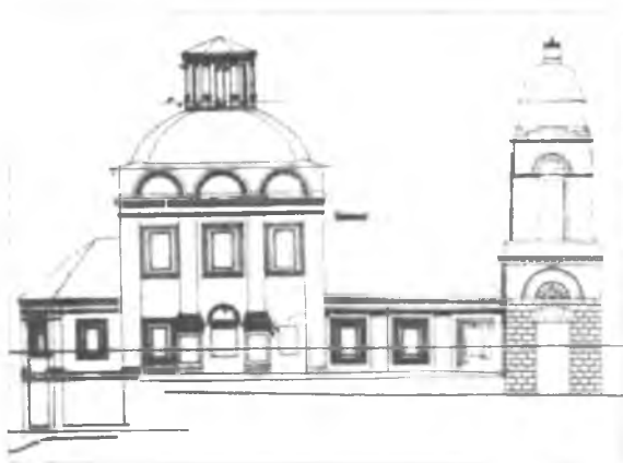
Церковь Максима Блаженного до реставрации