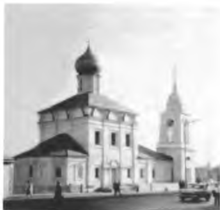
Церковь Максима Блаженного после реставрации