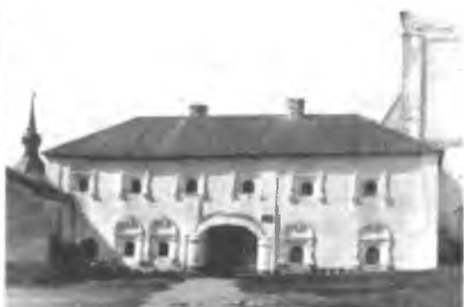
Келарский корпус после реставрации