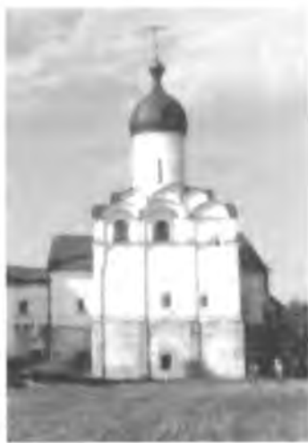
Церковь Благовещения после реставрации