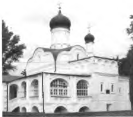
Церковь Зачатия Анны после реставрации