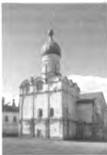
Церковь Благовещения до реставрации