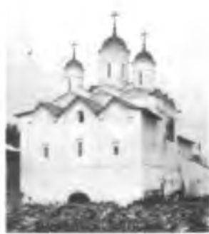
Церковь Преображения после реставрации