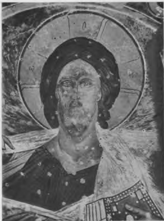
«Вседержитель». Фрески Рождественского собора Ферапонтова монастыря, 1502—1503 гг. Повреждение живописи из-за коррозии гвоздей, утраты красочного слоя вследствие неблагоприятных температурно- влажностных условий

Русского Севера опубликован в ежегодниках Научного совета по истории мировой культуры АН СССР «Памятники культуры. Новые открытия» 6 . Невозможно переоценить также значение издаваемого Северным отделением Археографической комиссии АН СССР под руководством П. А. Колесникова сводного каталога памятников письменности, хранящихся в музеях Вологодской области 7 .