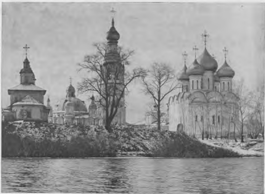
Вологда. Ансамбль Кремлевской площади XVI—XIX вв.

на новая культура, рождаясь, питалась жизненной силой культурной традиции, нередко в молодом буйстве и заносчивой самоуверенности отрицая свою зависимость от нее, хуля ее древние, уходящие в неведомую глубину прошлого корни и глумясь над ее величественным иссеченным ветрами времени челом. Но тем богаче и пышнее бывает крона древа новой культуры, чем теснее переплетаются ее свежие побеги и цветы с надежными и крепкими ветвями культуры прошлого, тем она сильнее и устойчивее к бурям истории.