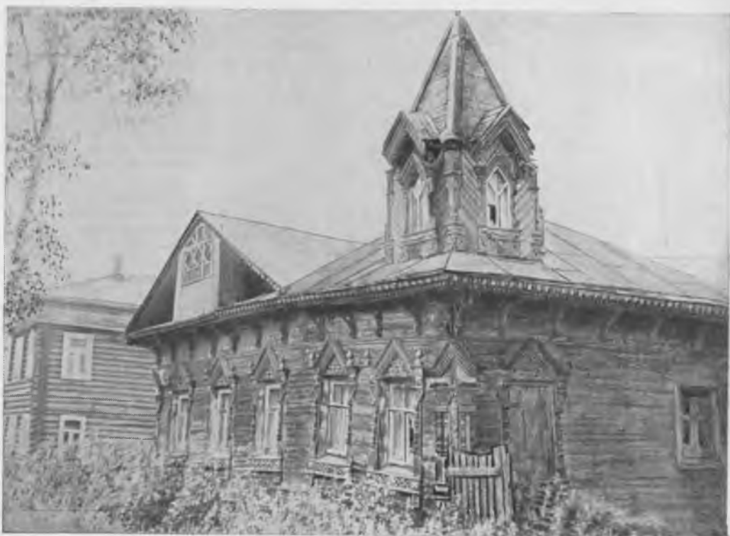
Жилой дом, вт. пол. XIX в. (г. Вологда, ул. Энгельса, 39). Аварийное состояние конструкций

мость между изучением, реставрацией и сохранением художественного наследия.