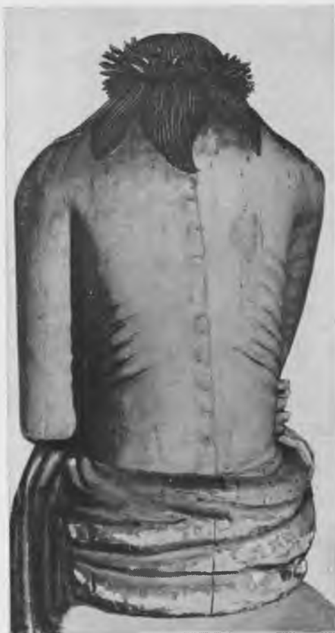
«Христос в темнице», вт. пол. XVIII в., дерево, полихромная роспись. ВОКМ. Обычные дефекты на деревянной скульптуре: утрата элементов резьбы, повреждения и позднейшие поновления полихромной росписи, поверхностные загрязнения