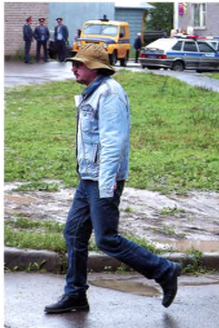
Череповец, 2006 г. Съемочная площадка фильма «Груз 200». В поношенной джинсовой куртке и рыбацкой шляпе череповчанам трудно было узнать знаменитого на весь мир режиссера.

В последний день «череповецких» съемок работали в неприметном дворе на улице Маяковского. И здесь за работой Алексея Балабанова могли понаблюдать все желающие. Эпизодик снимался крохотный и на экране ему отвели всего десять секунд, но на его примере можно было понять, как работает