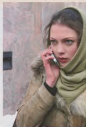
Кадр из сериала «Служба 21»