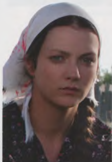
В роли Галины Брежневой («Галина»)