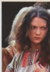
В роли Танюши («Пелагея и белый бульдог»)