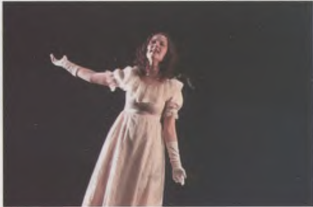
В роли Наталии Горич в спектакле «Горе от ума»

Но я не зря «задержалась» на два года в Вологде: ведь именно в год моего поступления курс набирал Алексей Бородин. В его мастерской нас учили не только актерству — нас учили честности: по отношению к себе, к окружающим, к профессии. Я считаю, что к каждой профессии — где бы и кем ты ни работал — надо относиться творчески, любить ее. Учеными доказано, что счастье напрямую зависит от творчества.