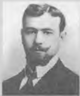
Александр ХАНЖОНКОВ (1877 - 1945) Русский кинопредприниматель и кинодеятель, был руководителем первого крупного русского кинопредприятия, выпускавшего в 1907 - 1908 гг. игровые фильмы, а в 1911 - 1912 - хроникальные и этнографические картины и мультфильмы. В 1920 - 1923 годах жил за границей. В 1923 году вернулся в Россию. Участвовал в развитии советской кинематографии.