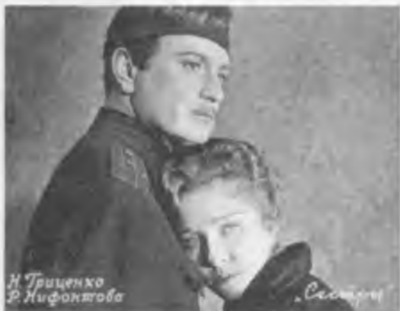
В 1958 году в кинотеатре имени Горького города Вологды появилась возможность для показа широкоэкрannого кино. Зрители увидели фильм «Сестры» из киноэпопеи «Хмурое утро».