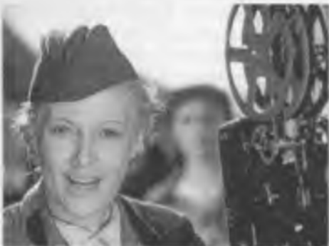
Боевой киносборник № 4 «Победа за нами», Стрелка - Любовь Орлова.

1 декабря 1942 года кинотеатр «Искра» демонстрирует фильм «Концерт - фронту». В нем снимались самые известные тогда певцы Клавдия Шульженко, Лидия Русланова, Иван Козловский, Леонид Утесов.