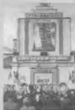
Кинотеатр им. М. Горького в 1958 году.