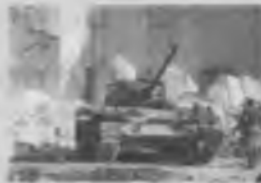
Разрушение кинотеатра им. Горького танками в сентябре 1942 года.