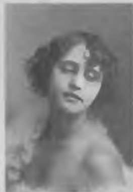
Вера ХОЛОДНАЯ (1893 - 1919) Самая знаменитая звезда русского немого кино. Начала сниматься в кино в 1914 году. За свой короткий кинематографический путь (около четырех лет) снялась в 35 фильмах у режиссеров Е. Бауэра, П. Чардынина, В. Висковского, Ч. Сабинского.

В Вологде в 1957 году был построен кинотеатр «Родина» на улице Чернышевского; в январе 1960 года принял первых зрителей кинотеатр «Мир» в поселке Молочное; в