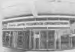
Кинотеатр им. Ленинского комсомола. 1997 год.