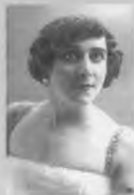
Вера КОРАЛЛИ (1889 - 1972) Русская балерина. С 1906 года в Большом театре. С 1914 года работала в кино. Снялась в известных немых фильмах «Наташа Ростова», «Родственные души», «Умиравший лебедь». С 1918 года жила за границей. Выступала в гастрольных балетных труппах.