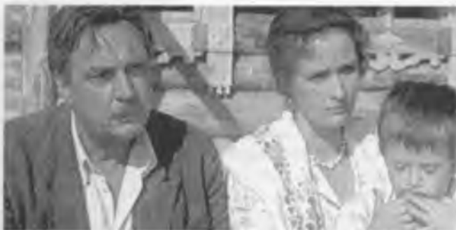
Кадр из фильма «Любовь земная» режиссера Евгения Матвеева.

кон. Сцену удачно приспособили для спектаклей и киноэкрана. Обновленный кинотеатр под новым названием «Темп» открылся 18 января 1925 года показом фильма «В сумерках Лондона». Демонстрация фильмов сопровождалась игрой на пианино, а иногда и на нескольких музыкальных инструментах. В газете «Советская мысль» от