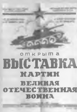
Афиша выставки в кинотеатре имени Горького. 1943 год.