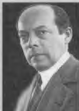
Владислав СТАРЕВИЧ (1882 - 1965) Создатель объемной мультипликации в мировом кино. Поставил знаменитые фильмы «Прекрасная Люканида» (1912), «Стрекоза и муравей» (1913). Эмигрировал после революции во Францию.