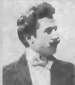
Александр ДРАНКОВ (1868 - ?) Фотокорреспондент, кинооператор, кинопредприниматель. Вошел в историю кино как создатель сенсационных хроник: снимал выдающегося актера В. Давыдова на даче, писателя Л. Н. Толстого в день его восьмидесятилетия, писателя А. М. Горького в дни его пребывания на острове Капри. Снял первый русский игровой фильм «Понизовая вольница». Эмигрировал в 1920 году. Умер в США.

Одним из музыкантов, игравших на мандолине в кинотئاتре «Рекорд» осенью 1910 года, был В. М. Молотов (позднее председатель Совнаркома, а затем министр ино-