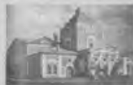
Дом искусств в городе Вологде.