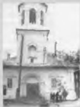
Здание Вологодского кинопроката в бывшей церкви Александра Невского на Кремлевской площади. 1948 год.

Работники киносети области сами участвовали в различных патриотических движениях в годы войны.