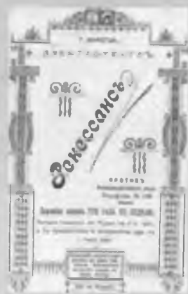
Программа электротейатра «Ренессанс».

23 декабря 1909 года открылся новый электротейатр «Идея». Он находился на плавучей барже, принадлежащей Я. Г. Коткову. Местом ее расположения была стоянка на реке Вологде напротив речного училища у Красного моста. Театр-кинематограф был приспособлен на барже с деревянным корпусом и внутренним деревянным оформлением. Он состоял из зрительного зала, расположенного в кормовой части баржи, и фойе, к нему примыкали два небольших помещения - курительная и кладовая. Для отопления зрительного зала в фойе были поставлены три железных печи. В машинном отделении, за фойе, уста-