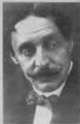
Евгений БАУЗЕР (1865 - 22.07.1917) Русский режиссер, художник. В кино с 1912 года. Развил жанр городской психологической драмы, салонной мелодрамы. Разработал оригинальный киноязык и стиль: монтаж, крупный план, движение камеры, глубинные мизансцены. В его картинах начинали творческий путь Вера Холодная, Иван Мозжухин, Витольд Полонский, Лев Кулешов.