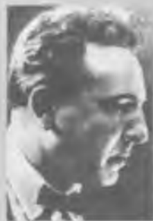
Яков ПРОТАЗАНОВ (1881 - 1945) Известный русский кинорежиссер. Режиссерскую деятельность начал в 1911 году. Поставил до революции около 80 картин, самые знаменитые из них «Пиковоы дама» (1916), «Отец Сергий» (1918). Оба фильма - с участием Ивана Мозжукина. Эмигрировал в 1921 году. Вернулся в Россию в 1924 году. Участвовал в становлении и развитии советского кино.