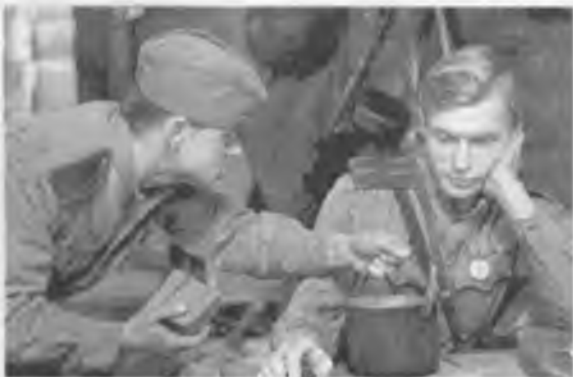
В 1971 году в кинотеатре им. Ленинского комсомола был показан 3-й фильм «Направление главного удара» из киноэпопеи «Освобождение»