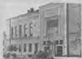
Кинотеатр «Искра» в 1961 году (бывший электротейатр «Рекорд»).