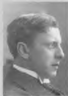
Витольд ПОЛОНСКИЙ (1879 - 1919) Театральный актер. В 1915 году начал сниматься в кино. Снялся в 45 фильмах, в том числе в фильме «Наташа Ростова» по роману Л. Н. Толстого «Война и мир».