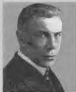
Петр ЧАРДЫНИН (1868 - 1934) Русский актер, режиссер и сценарист. Кинематографическую деятельность начал в 1907 году у А. Ханжонкова. До 1917 года поставил более 100 картин. Например, фильм «Пиковая дама» (1910). После революции эмигрировал. Вернулся в Россию в 1923 году. Участвовал в развитии советского кино.

Осенью 1941 года фронт подошел к границе Вологодской области. С 7 октября бои шли на ее территории в Оштинском районе (ныне Вытегорский). Вологда стала прифронтовым городом. То и дело раздавались сигналы воздушной тревоги. Горожане участвовали в строительстве оборонительных рубежей. Создавалось народное ополчение.