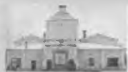
Кинотеатр им. М. Горького в 50-е годы.