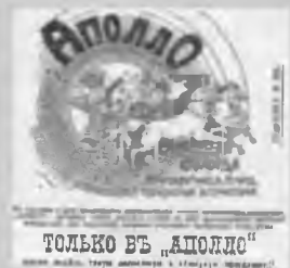
Эмблема электротейатра «Аполло» в г. Вологде.