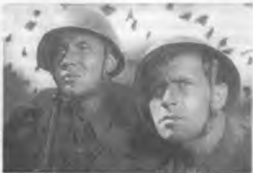
Кадр из фильма «Два бойца».