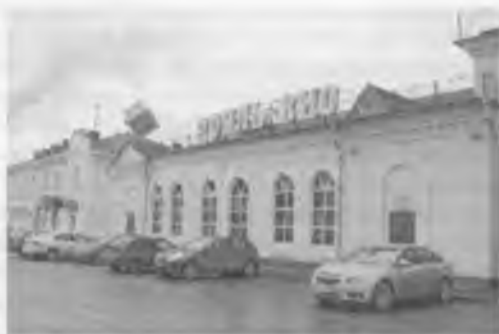
Кинотеатр «Рояль-Вио» в городе Череповце в начале прошлого века и сегодня.