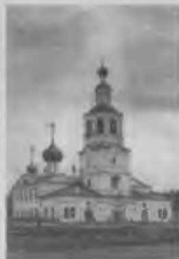
Спасо-Всеградский собор. Фото 1924 года.

19 февраля 1943 года в кинотеатре им. Горького в программе «Союзкиножурнал» (выпуск № 8) был показан сюжет «Завершение ликвидации окруженных под Сталинградом