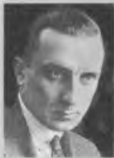
Иван МОЗЖУХИН (1889 - 1939) Звезда русского кино. Среди ранних ролей выделяется герой фильма «Домик в Коломне» по Пушкину, воплотил на экране образы Николая Ставрогина в одноименном фильме по «Бесам» Достоевского, Германа в «Пиковоы даме» по Пушкину и отца Сергия в одноименной ленте по Л. Толстому. Эмигрировал за границу в 1920 году. Заслужил репутацию одного из крупнейших актеров немого кино. Умер в 1939 году в Париже.