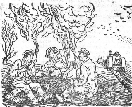
Много дыму, да мало пыли.