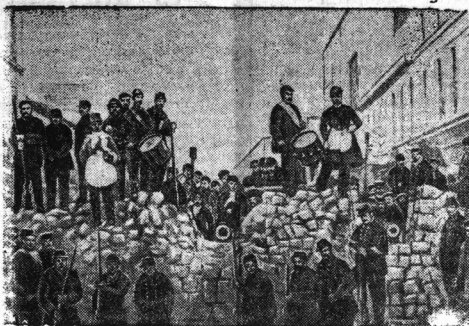
—Баррикады на улице Басфруа и ул. Шаронн в Париже 18 марта 1871 г.

Все излишки яиц после выполнения обязательств по сдаче яиц государству остаются в полном распоряжении колхозов, колхозников и единоличников. (ТАСС).