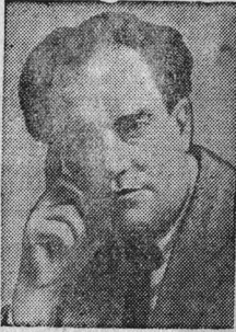
В. В. Куйбышев.

25 января 1935 года Советская страна и коммунистическая партия потеряли одного из лучших своих сынов—члена Политбюро ЦК ВКП(б), заместителя председателя Совнаркома СССР, председателя Комиссии советского контроля — Валерия Владимировича Куйбышева.