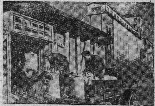
На Алексеевском элеваторе. Колхозники колхоза „Ленинский путь“, Сталинградской области сгружают пшеницу, привезенную на своих машинах.

Центральный Комитет ВКП(б) и Совнарком СССР обязали партийные, советские, комсомольские, земельные и заготовительные органы в целях проведения в сжатые сроки уборочных работ, недопущения потерь урожая, а также своевременного и полного выполнения государственного плана заготовок сельскохозяйственных продуктов, широко мобилизовать массы колхозников, работников МТС, заготовительного аппарата на своевременное проведение уборочных работ и на выполнение государственных планов заготовок в установленные Правительством сроки. Это постановление должно быть выполнено.