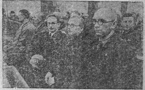
Делегация Эстонской Государственной Думы в зале заседаний.

Седьмая Сессия Верховного Совета СССР. Совместное заседание Совета Союза и Совета Национальностей.