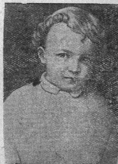
В. И. Ленин в возрасте 4-х лет.