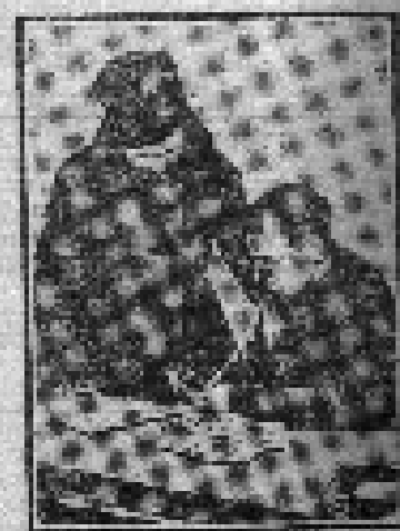
Комсомольцы ячейки РКП(б) в Тимановской ячейке РКП(б) мобилизовали средства в борьбе за перевыполнение плана. Воннегодский район мобилизовал средства в борьбе за финплан. Леденгский район мобилизовал средства в борьбе за финплан.

Оставшие комсомольцы по примеру ячейки в Тимановской ячейке РКП(б) мобилизовала средства в борьбе за перевыполнение плана. Воннегодский район мобилизовал средства в борьбе за финплан. Леденгский район мобилизовал средства в борьбе за финплан.