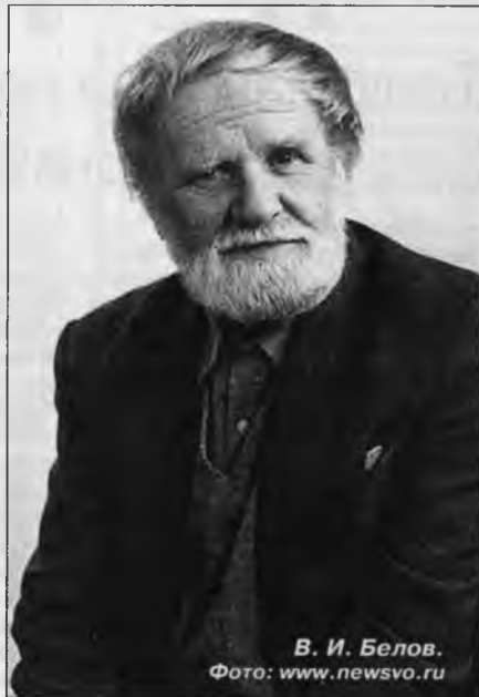
В. И. Белов.

бревнами, словно сомневаясь, что она имеет право на такое счастье - кинуться к матери на шею. «И вдруг Катерина почуяла, как у нее чего-то тоскливо и больно сжалось в груди, оглянулась сама не своя, кинулась к тому концу бревен: