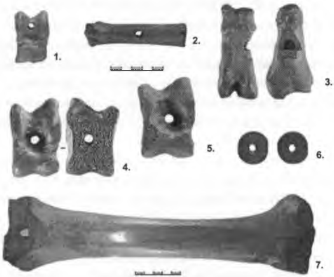
Рис. 3 – костяные игрушки. 1; 4-5 – кости – погремушки; 2 – «брунчалка»; 3 – кость для игры в бабки; 6 – шашка; 7 – костяной конек.