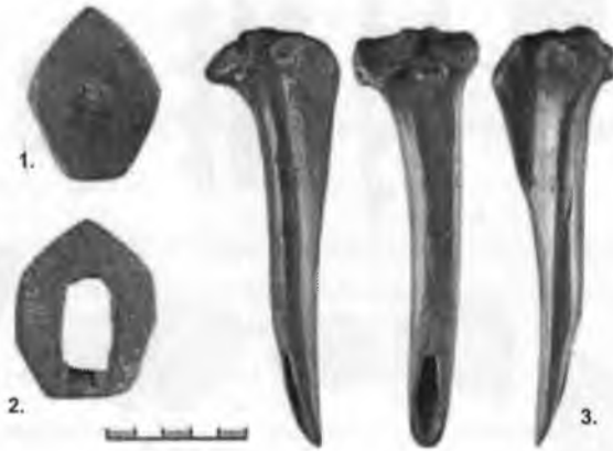
Рис. 2. 1-2 – роговые обоймицы; 3 – орудие (кочедык?).