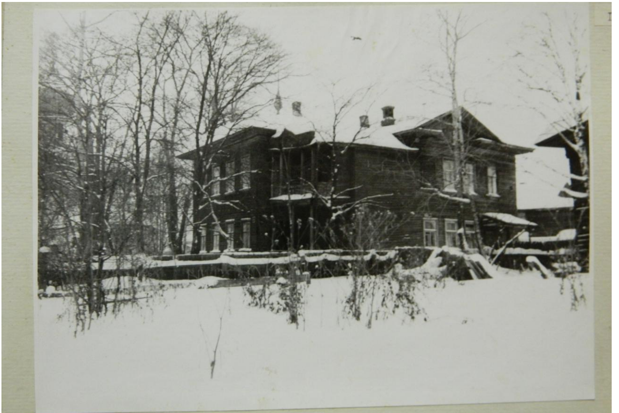
улица ЗАСО ДИМСКОГО 13