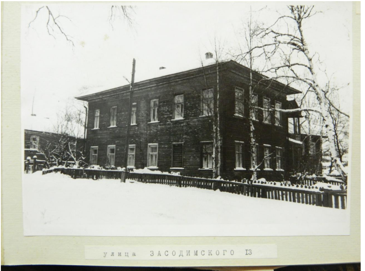
улица ЗАСОДИМСКОГО 13