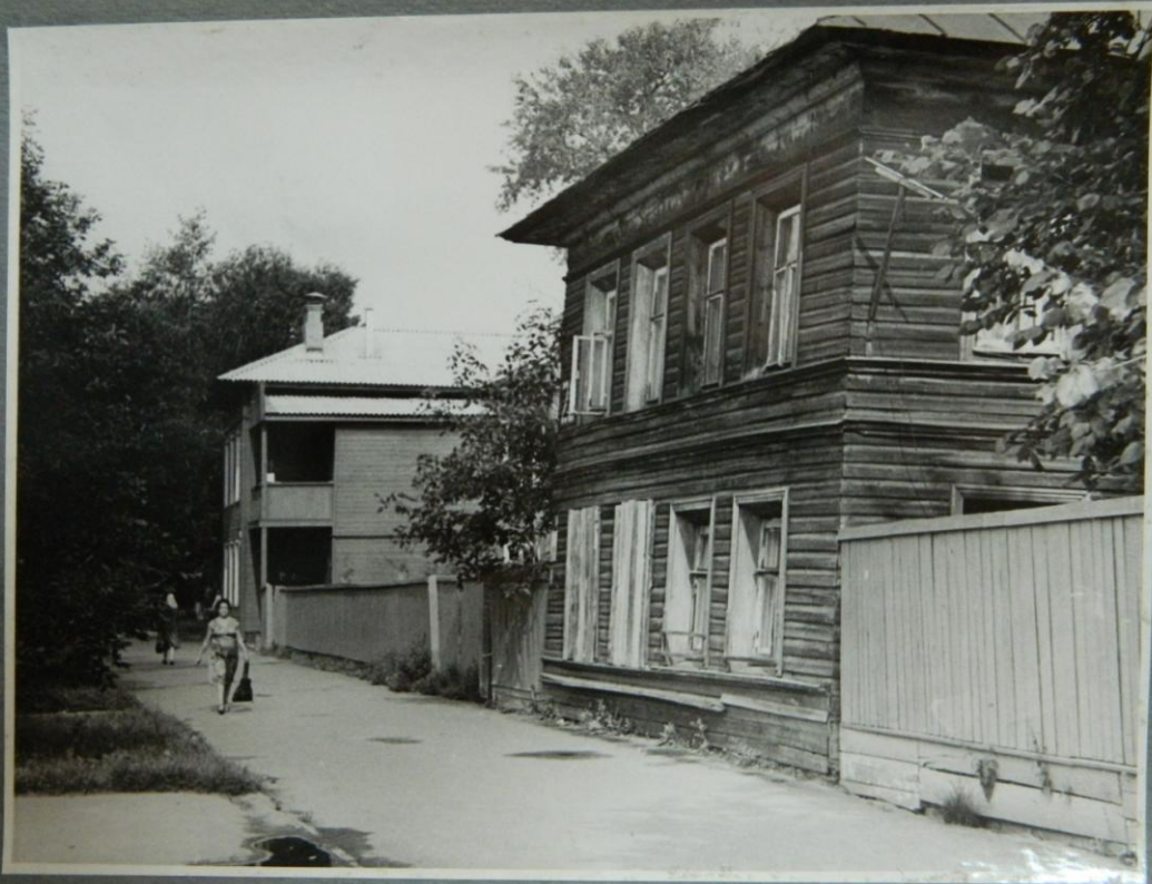
УЛИЦА КЛАРЫ ЦЕТКИН, Д. 28