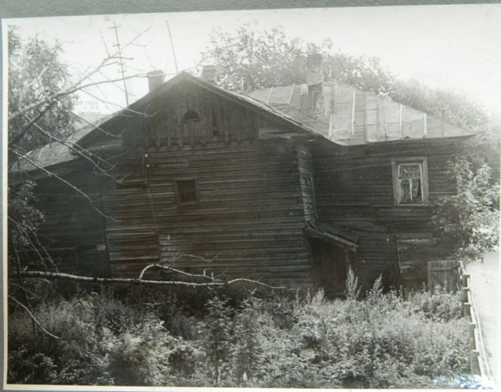
УЛИЦА КЛАРЫ ЦЕТКИН, Д. 28