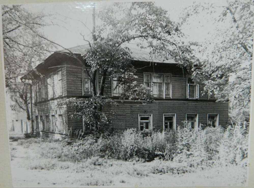
УЛИЦА ГОГОЛЯ, Д. 41