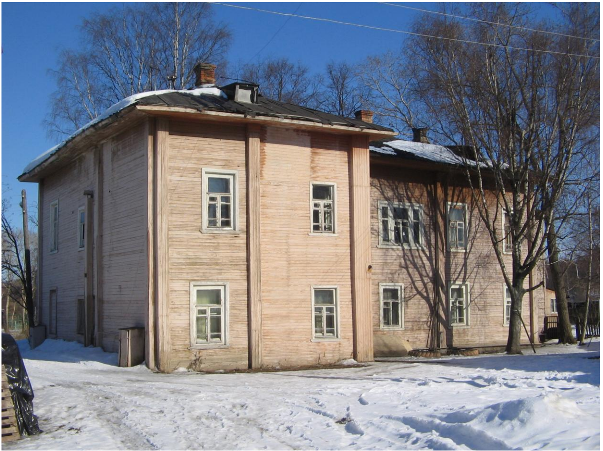
и утраченный дом по ул. Бурмагиных 1а: