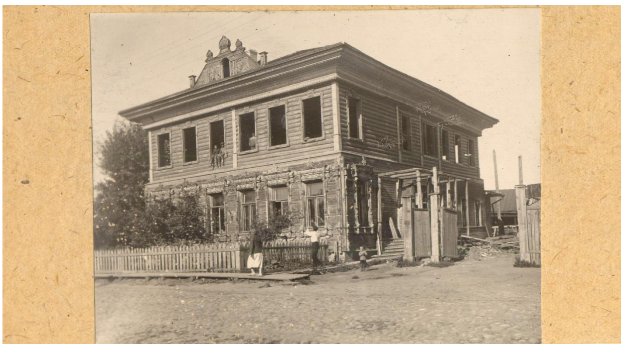
Надстройка жилого дома по ул. Менжинского. 1939 г.

Над несохранившимся домом по ул. Предтеченской 44 в 1939 г. был надстроен второй этаж, в результате чего он приобрёл свой «исторический» вид: