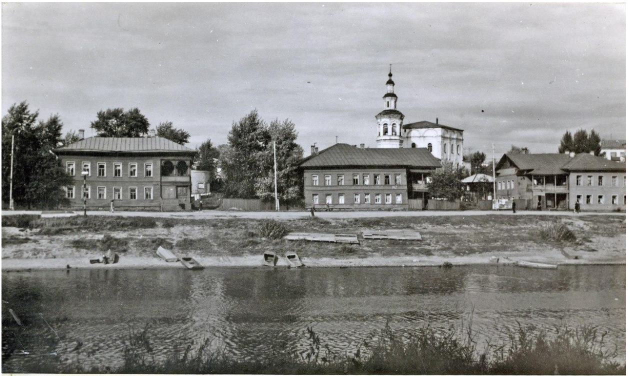
Набережная в Армии 1976 г. у Красного моста.

Окладная книга 1907-15 гг. (ГАВО ф. 475 оп. 1 д. 1668) фиксирует с ошибочным указанием местоположения домовладения: