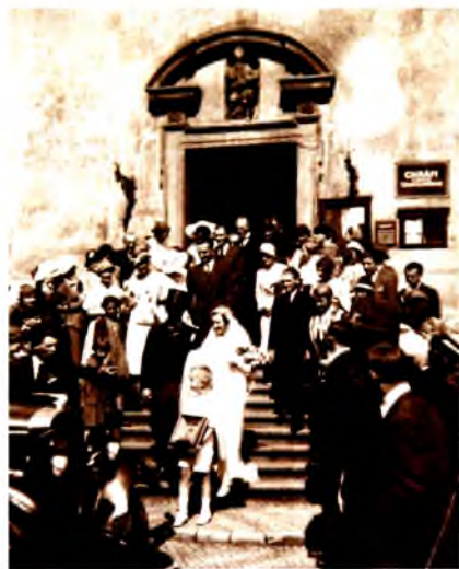
Свадьба матери в Пражском соборе