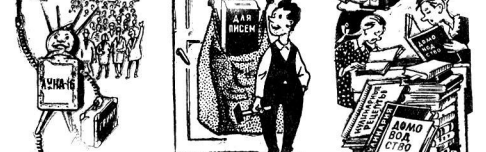
С. КОРАБЛА НА БАЛ. ПРЕД ПРАЗДНИКОМ. Рисунки И. НИКОЛАЕВА.