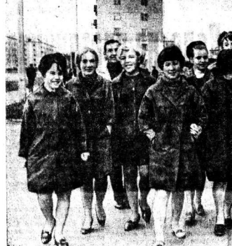
ВОЛОГАДА. Учащиеся педагогического и музыкального учебных заведений.