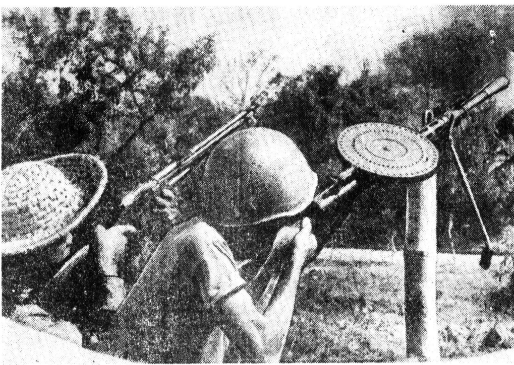
ДРВ. Бойцы народной милиции ведут огонь по американским самолетам, напавшим на район Хань Три — предместье Ханоя.