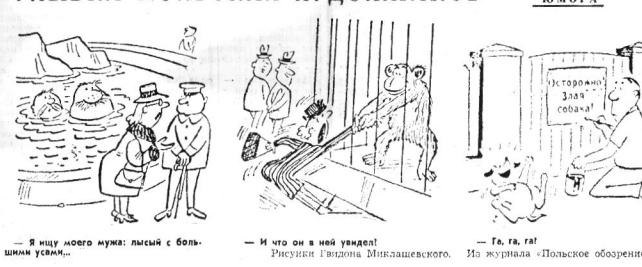
В ясную погоду можно улыбаться с польскими улыбки... Улыбки польских художников...