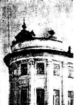
Дом на улице Лермонтова, где размещался редакция газеты «Новая Волна».