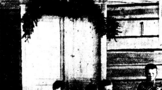
Урок объяснительного чтения в земском училище бывшей Вологодской губернии.

Вот почему в нашей стране так важно было в первую очередь поднять уровень начального образования. Третий класс заканчивали четверть одной пятой, а четвертый — около одной двадцатой пятой части поступивших в первый класс.