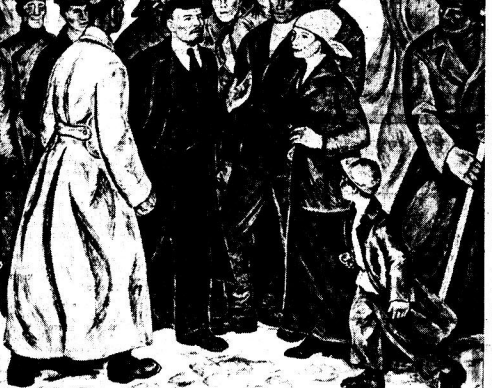
Москва, 9 августа в Центральном Выставочном зале открылась выставка «Художники Москвы — 50 лет после революции». В ней участвуют почти все деятели восточного искусства столицы — 20 живописцев, скульпторов, графиков, музыкантов, поэтов, артистов балета, артистов цирка, артистов эстрады. Выставка открылась в 10 часов утра. В ней участвуют почти все деятели восточного искусства столицы — 20 живописцев, скульпторов, графиков, музыкантов, поэтов, артистов балета, артистов цирка, артистов эстрады.

НА СНИМКАХ - Вьетнамская армия. Вьетнамская армия. Вьетнамская армия.