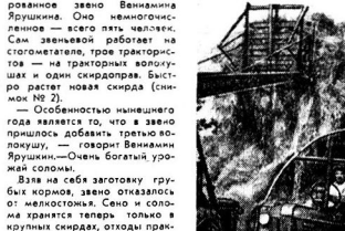
Каждый день убирают зрелые площади...