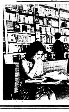
В центре: Богомонни удар. Внизу: Богомонни удар...