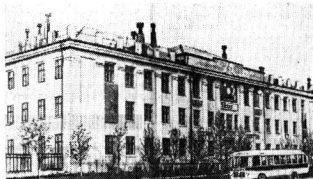
Городское профтехучилище № 2 (г. Череповец).