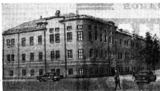
Городское профтехучилище № 7 (г. Вологод).