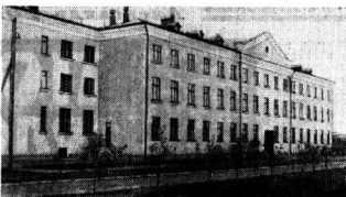
Городское профтехучилище № 17 (г. Вологод).