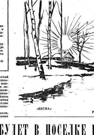
Рис. Б. ЧЕРЕДИНА.